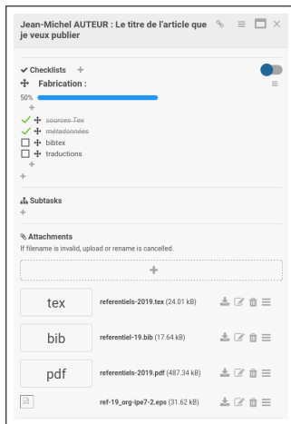
(b) ...et la fin