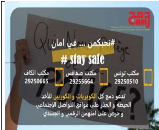
Figure 7. Appel à la vigilance sur les réseaux sociaux : « Votre sécurité physique dépend de votre sécurité numérique ». Publié par Damj le 17 janvier 2021.