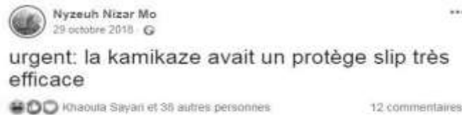
Figure 3. Une capture d'écran du post de Nizar sur le protège-slip de la kamikaze.

Les représentations sociales diffusées dans l'espace public amènent les pouvoirs publics à s'emparer de la question des femmes. Un élément marquant qui ressort des publications est les sous-vêtements de la kamikaze, et plus particulièrement la lingerie. En effet, lorsque le sexisme est exprimé sous l'aspect de l'humour, il peut sembler moins offensif. Toutefois, l'analyse tend à démontrer un certain usage caricatural de l'intimité de la femme, comme le démontre la figure ci-dessous.