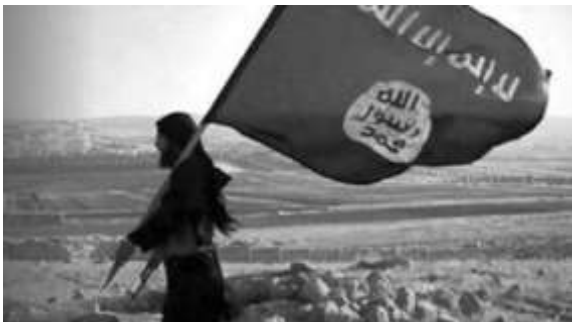
Figure 5. Image issue d’une vidéo de propagande.

Ci-dessous, à gauche, se trouve une capture d’écran d’une vidéo de propagande et à droite, une autre image de la même vidéo transformée en mème.