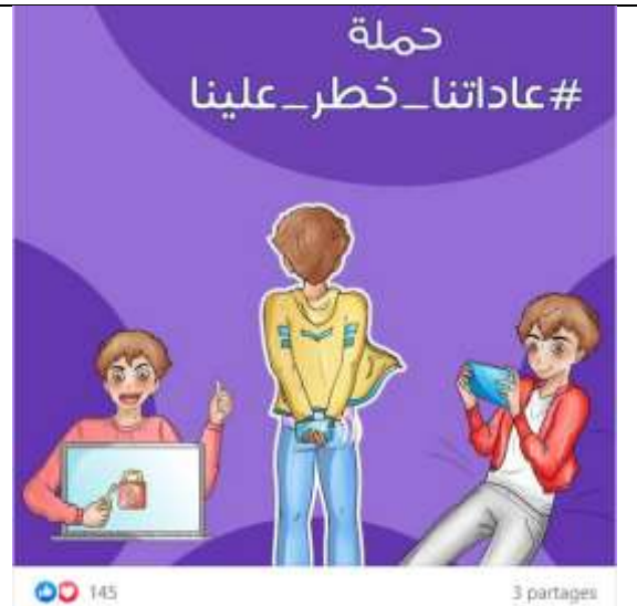
Figure 8. « Nos pratiques numériques sont dangereuses pour nous ». Publié par Mawjoudin le 3 novembre 2021.

Cette campagne tend à couvrir tous les domaines du numérique (sites web de rencontres, réseaux sociaux, applications...) qui peuvent être investis naïvement par les membres de la communauté qui méconnaissent les logiciels de géolocalisation ou qui sont convaincus de l'anonymat des réseaux sociaux. Ainsi, la campagne appelle les utilisateurs des sites et applications de rencontres LGBT à être vigilants sur les informations communiquées pour éviter les pièges et donne des conseils sur les applications recommandées (figure n° 9). Elle attire également l'attention sur les traces laissées sur les réseaux sociaux qui pourraient être utilisées par des harceleurs homophobes ou exploitées par les autorités pour répertorier les membres de la communauté (figure n° 10).