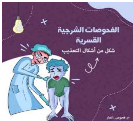
Figure 3. Le test anal est une forme de torture. Diffusée par toutes les associations LGBT.

Facebook a également rendu possible la médiatisation d'une campagne contre le test anal (figures n° 3 et n° 4) infligé aux personnes accusées d'homosexualité. Étant donné le climat homophobe, la pudeur régnante dans les médias classiques et l'omerta imposée par les autorités autour de la pratique du test anal, cette dénonciation n'aurait pu être lancée sur aucun canal classique.