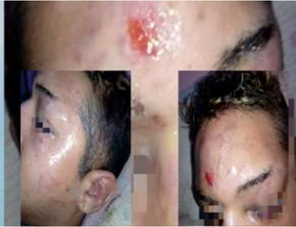
Figure 1. Traces du lynchage en public d'un jeune homosexuel. Photos publiées sur la page Facebook de Shams le 14 septembre 2020.