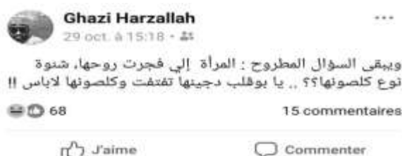
Figure 1. Une capture d'écran du post de Ghazi sur la marque de lingerie de la kamikaze. Traduction : « La question qui se pose : quelle est la marque de la culotte de la femme qui s'est fait exploser ? Son jean est en miettes et sa culotte est intacte ! »

En Tunisie, comme ailleurs, au nom de la liberté d'expression, les blagues sexistes restent souvent banalisées et tolérées. En effet, le travail sur le genre (entendu ici comme le sexe en tant qu'il est socialement construit) permet un accès aux représentations sociales et aux enjeux du pouvoir qui les accompagnent (Damian-Gaillard et al. 2014). Si l'essor des réseaux sociaux numériques a fortement contribué à réduire le seuil de tolérance aux propos et images sexistes, l'image de la femme dans les médias numériques souffre encore de nombreux stéréotypes (Granchet, 2017). Par ailleurs, l'offense aux femmes est perceptible par des blagues dites « misogynes » ou au travers de propos « sexistes » (Droin, 2017).