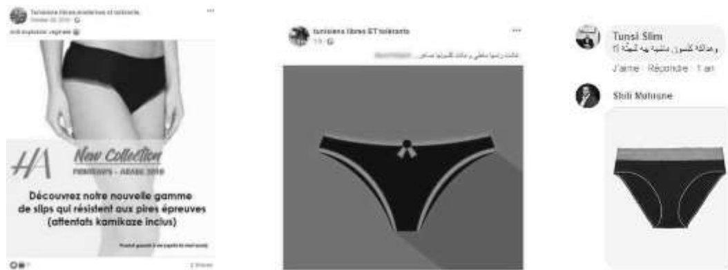
Figure 4. Des captures d'écran des mêmes concernant la lingerie de la kamikaze.

L'une des formes que prend cet humour est la réduction de la femme à son corps et de celui-ci à un objet sexuel. En effet, le corps d'une femme est souvent dissocié de sa personne, comme le démontre la figure ci-dessous, issue des pages publiques des « Tunisiens, libres, modernes et tolérants » (41 000 abonnés) et « Tunisiens Libres et Tolérants » (102 000 abonnés).