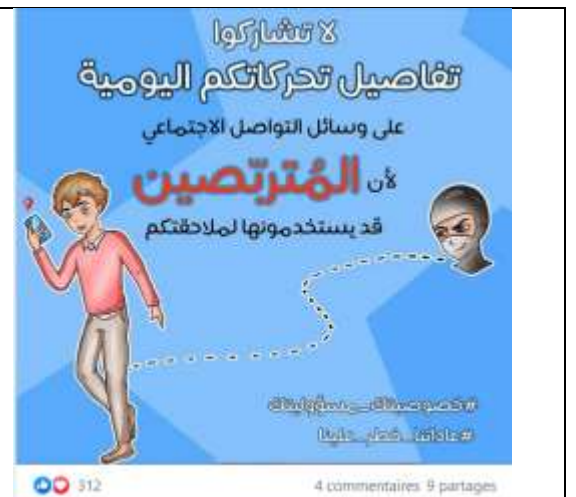
Figure 10. Dangers de la géolocalisation.