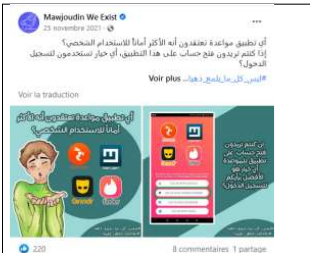
Figure 9. « Laquelle de ces applications de rencontres est la plus sûre ? » Publié par Mawjoudin le 25 novembre 2021.

Cette campagne tend à couvrir tous les domaines du numérique (sites web de rencontres, réseaux sociaux, applications...) qui peuvent être investis naïvement par les membres de la communauté qui méconnaissent les logiciels de géolocalisation ou qui sont convaincus de l'anonymat des réseaux sociaux. Ainsi, la campagne appelle les utilisateurs des sites et applications de rencontres LGBT à être vigilants sur les informations communiquées pour éviter les pièges et donne des conseils sur les applications recommandées (figure n° 9). Elle attire également l'attention sur les traces laissées sur les réseaux sociaux qui pourraient être utilisées par des harceleurs homophobes ou exploitées par les autorités pour répertorier les membres de la communauté (figure n° 10).