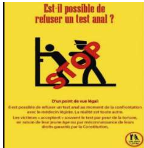
Figure 4. Affiche de Shams soulignant le droit de refuser un test anal.