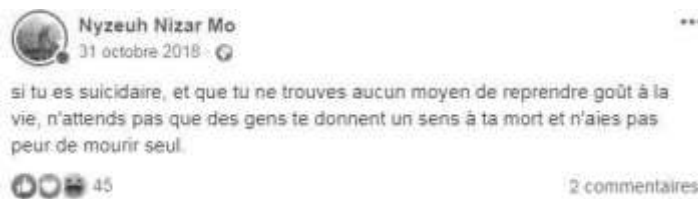
Figure 10. Une capture d'écran du post de Nizar

Dans le processus de déshumanisation, l'endoctrinement rend inopérant l'attachement aux êtres (Josse, 2018). Le futur terroriste n'existe plus en tant qu'individu, il devient insensible à la douleur d'autrui. L'unisson émotionnel, la solidarité et le respect de la vie sont bafoués, et les règles de base régissant l'humanité sont transgressées. Pendant notre enquête, nous remarquons que c'est notre échantillon qui prend cette posture et qu'il n'a aucune considération pour le respect de la dignité humaine.