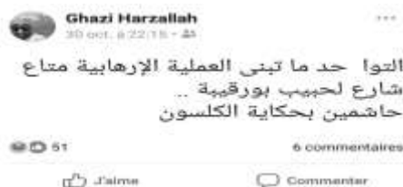
Figure 2. Une capture d'écran du post de Ghazi sur la lingerie de la kamikaze. Traduction « Jusqu'à maintenant, personne n'a revendiqué l'attentat terroriste de l'avenue Habib Bourguiba... Ils ont tous honte à cause de l'histoire des sous-vêtements. »

Nous analysons ici les façons dont les normes genrées sont représentées. Voici une sélection de quelques captures d'écran 159 du profil privé de Ghazi (homme, 40 ans, bac+6, pharmacien) rédigé en arabe dialectal que nous traduisons sous chaque figure.