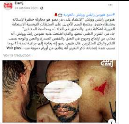
Figure 2. Damj dénonce, le 28 octobre 2021, l'agression physique de son responsable en publiant les photos des traces physiques.

Facebook a également rendu possible la médiatisation d'une campagne contre le test anal (figures n° 3 et n° 4) infligé aux personnes accusées d'homosexualité. Étant donné le climat homophobe, la pudeur régnante dans les médias classiques et l'omerta imposée par les autorités autour de la pratique du test anal, cette dénonciation n'aurait pu être lancée sur aucun canal classique.