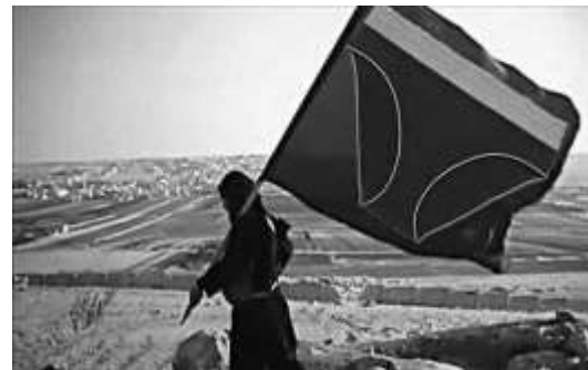
Figure 6. Image de la même vidéo transformée en mème.

À gauche, le drapeau est le symbole de l’État islamique (EI), étendard qui frappe aujourd’hui les esprits. Il devient un marqueur d’appartenance à l’EI de mouvements djihadistes. Il est donc indispensable de décrire une analyse sur ce qu’il signifie. L’inscription sur la partie haute est tirée de la formule arabe أشهد أن لا إله إلا الله / Achadou an lâ illâha illa-llâh , qui peut se traduire par « j’atteste qu’il n’y a pas de divinité en dehors de Dieu ». Une traduction littérale pourrait être « j’atteste qu’il n’y a pas de Dieu sauf Allah ».