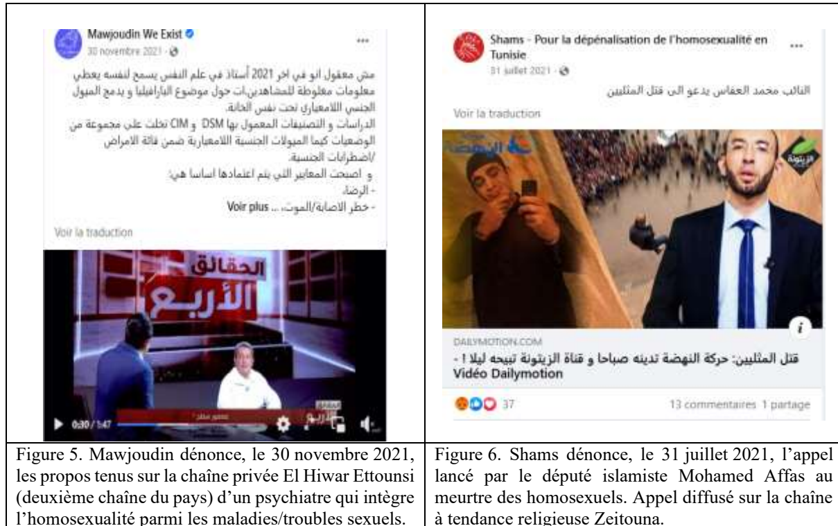
Figure 5. Mawjoudin dénonce, le 30 novembre 2021, les propos tenus sur la chaîne privée El Hiwar Ettounsi (deuxième chaîne du pays) d'un psychiatre qui intègre l'homosexualité parmi les maladies/troubles sexuels.

Au-delà de la dénonciation, le recours aux médias numériques a permis aux associations et aux militants de déconstruire le discours hétéronormé et hétéronormatif diffusé dans les médias traditionnels dominants (figure n° 5) et de prouver la présence de propos homophobes et d'appels à la haine et aux meurtres d'homosexuels sur les chaînes de télévision (figure n° 6).