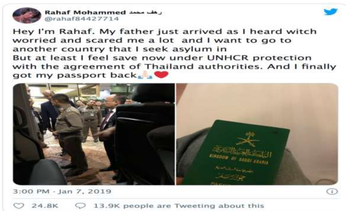
Figure 3. Tweet (7 janvier 2019) du compte de Rahaf Mohammed

Toujours sur un registre militant, mais concernant les droits des femmes saoudiennes en général, c'est via son mobile connecté aux réseaux socionumériques que la dissidente Rahaf Mohammed fuit l'Arabie saoudite puis jouit de l'asile au Canada. En janvier 2019, profitant d'un séjour familial au Koweït, la jeune Saoudienne prit effectivement un avion pour Bangkok dans le but de fuir en Australie (Mogul, 2019). Arrêtée en Thaïlande et se voyant confisquer son passeport, elle se saisit de Twitter pour attirer l'attention des organisations internationales (cf. figure 3) sur les menaces qui pesaient sur elle.