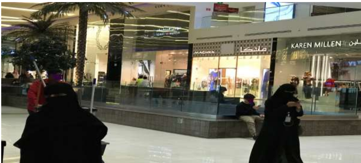
Figure 2. Femme en niqāb consultant son téléphone portable en marchant (à droite), Panorama mall (centre commercial), Riyad, 10 novembre 2018.

Sur un plan de la sophistication, l'objet est souvent personnalisé (un anneau y est collé au dos pour le tenir dans son doigt, le nom y est même parfois gravé). La photographie infra de la figure 2, prise dans un centre commercial de Riyad (l'incontournable mall de la société saoudienne) représente une scène triviale tant il est courant et banal de se promener avec son téléphone à la main sans qu'il ne fasse a priori l'objet d'un usage précis si ce n'est ostentatif. Le smartphone est en effet un objet pour s'exhiber, un objet de stylisation et de présentation de soi (Le Renard, 2011 ; Nova, 2018), une technique du corps (Mauss, 1934), une manière du show off , expression très couramment utilisée par les Saoudiennes « branchées » pour critiquer celles qui s'exhibent par le biais de cet accessoire téléphonique en vue de se distinguer ( cf. infra ).