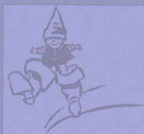
Illustration de Maxime Rebière