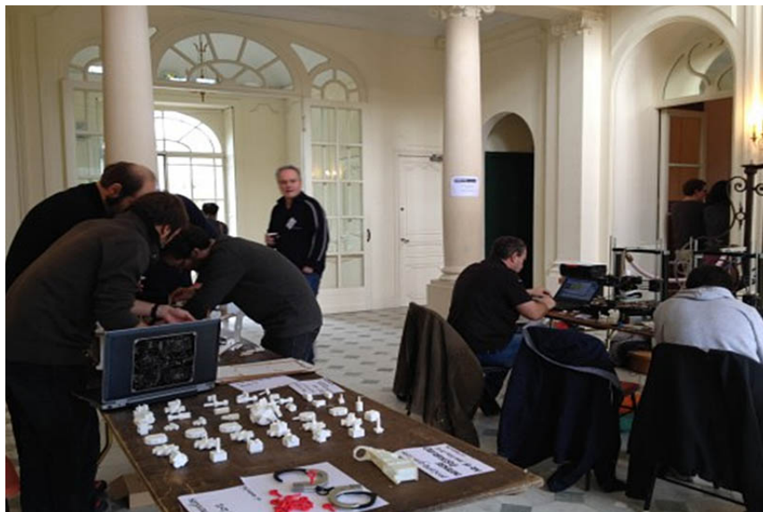
Atelier de création numérique : LabFab Rennes et RandomLab Saint-Étienne

Cette rencontre annuelle, dont le programme se construit directement sur place par les participants sous la forme d'atelier partagé des connaissances, « permet aux acteurs de la recherche en SHS utilisant des technologies numériques d'échanger informations, idées, solutions et savoir-faire autour de leurs pratiques ». Échanges d'autant plus fructueux que se réunissaient cette année pour la première fois non seulement bibliothécaires, chercheurs et ingénieurs en SHS, mais aussi les communautés des arts et du design concernées par les humanités numériques (conception de programme, design d'interface, design d'information, cartographie).