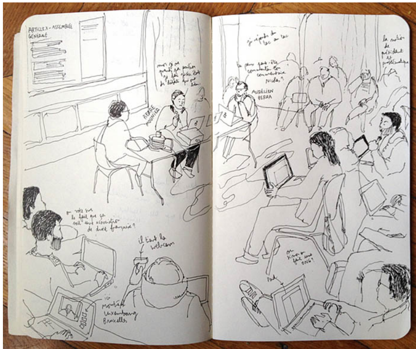
Débats sur la création de l'Association francophone des humanités numériques

C'est dans une ambiance décontractée, dont seule la formule conviviale et informelle du ThatCamp a le secret, que se tenait en octobre dernier à Saint-Malo l'édition 2013 sur les relations entre humanités numériques et bibliothèques : quelles pratiques informationnelles pour les chercheurs ? Quelles compétences en jeu ? Quid des évolutions des profils et du dialogue des bibliothèques avec la recherche ?