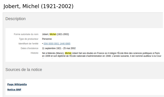
FIGURE 1. Extrait d'une notice de producteur des Archives nationales

2.1.1. Le référentiel des Archives nationales. Les Archives nationales utilisent depuis 2013, dans leur système d'information, un référentiel des producteurs. Cela facilite l'indexation (tout en améliorant sa qualité) et l'accès aux documents. En 2016, il comptait 14100 notices validées et publiées dont près de trois quarts de notices de collectivités 8 . C'est un vrai référentiel qui permet de faire des liens entre les notices, les documents etc. Mais l'objectif est l'ouverture du référentiel et son interopérabilité. Pour Florence Clavaud, « l'interopérabilité se construira aux Archives nationales quasiment exclusivement sur les référentiels 9 . »