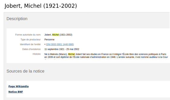
FIGURE 1. Extrait d'une notice de producteur des Archives nationales

2.1.1. Le référentiel des Archives nationales. Les Archives nationales utilisent depuis 2013, dans leur système d'information, un référentiel des producteurs. Cela facilite l'indexation (tout en améliorant sa qualité) et l'accès aux documents. En 2016, il comptait 14100 notices validées et publiées dont près de trois quarts de notices de collectivités 8 . C'est un vrai référentiel qui permet de faire des liens entre les notices, les documents etc. Mais l'objectif est l'ouverture du référentiel et son interopérabilité. Pour Florence Clavaud, « l'interopérabilité se construira aux Archives nationales quasiment exclusivement sur les référentiels 9 . »