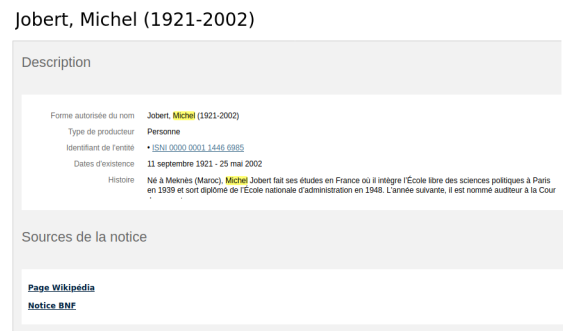
FIGURE 1. Extrait d'une notice de producteur des Archives nationales

2.1.1. Le référentiel des Archives nationales. Les Archives nationales utilisent depuis 2013, dans leur système d'information, un référentiel des producteurs. Cela facilite l'indexation (tout en améliorant sa qualité) et l'accès aux documents. En 2016, il comptait 14100 notices validées et publiées dont près de trois quarts de notices de collectivités 8 . C'est un vrai référentiel qui permet de faire des liens entre les notices, les documents etc. Mais l'objectif est l'ouverture du référentiel et son interopérabilité. Pour Florence Clavaud, « l'interopérabilité se construira aux Archives nationales quasiment exclusivement sur les référentiels 9 . »