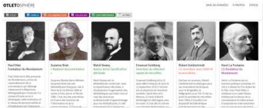
Figure 3 - L'Otletosphère, partie base de données.

Nous avons souhaité rendre la navigation, à l'intérieur de notre cartographie, la plus interactive possible en proposant à l'utilisateur un certain nombre d'options d'affichage. Ainsi, l'utilisateur peut facilement parcourir le graphe de relations, agrandir/diminuer l'espace de travail, effectuer un zoom sur une partie et déplacer chaque nœud. Il peut également filtrer les relations interpersonnelles à afficher en activant ou désactivant une ou plusieurs catégories de liens ; le graphe se reconfigure alors automatiquement en fonction de ses choix. En plus de l'aspect ludique qu'elles lui confèrent, ces fonctionnalités posent le projet comme un véritable outil au service de l'utilisateur/chercheur.