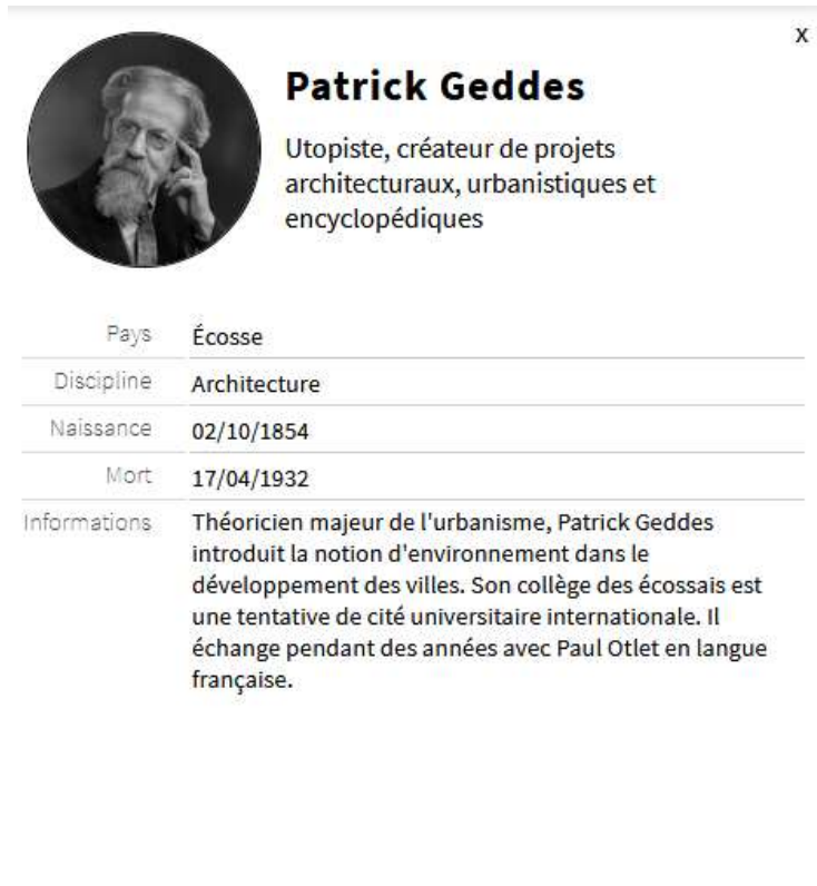
Figure 2 - Un exemple de fiche acteur.

La partie intitulée « base de données » permet d'accéder à la base des acteurs de la cartographie sous forme de fiches succinctes qu'il est possible de parcourir en faisant défiler horizontalement la page (Figure 3).