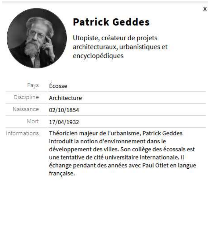
Figure 2 - Un exemple de fiche acteur.

La partie intitulée « base de données » permet d'accéder à la base des acteurs de la cartographie sous forme de fiches succinctes qu'il est possible de parcourir en faisant défiler horizontalement la page (Figure 3).