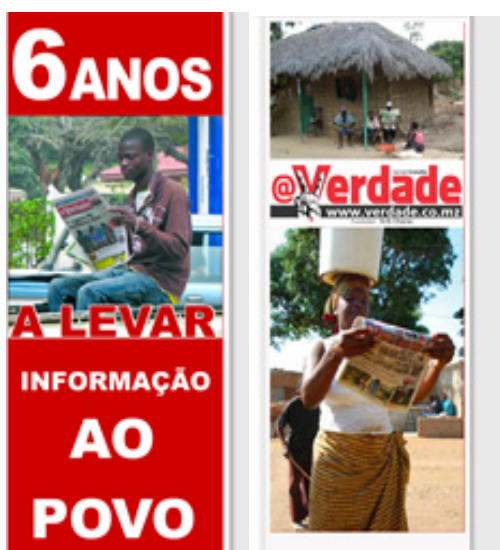
Figure 1 : la version papier du journal

L'homme d'affaire Mozambicain, Erik Charas, a révolutionné la presse au Mozambique en diffusant le premier journal papier gratuit, @Verdade (AV) avec le plus fort tirage jamais réalisé. En accord avec son slogan, « apporter l'information au peuple » (levar informação ao povo), il est le seul journal du pays à avoir délocalisé son équipe de rédaction dans le nord du pays, zone très peuplée mais très rurale avec une population ayant difficilement accès à l'information. Pour pallier la barrière du coût, il propose un « recyclage de l'information », invitant chacun à faire circuler et partager la lecture de chaque numéro paru (recicle a informação: passe este jornal a outro leitor). Enfin, il fut le premier à créer une version en ligne de son journal ( http://www.verdade.co.mz/ ) avec une ligne éditoriale spécifique.