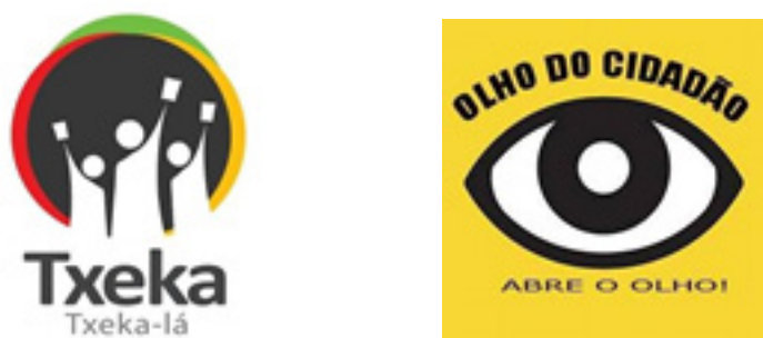
Figure 5 : les logos de la plateforme Txeka et d' Olho do Cidadão

Les membres fondateurs d'ODC portent un projet très ambitieux, patriotique et militant, puisqu'ils cherchent à promouvoir une plus grande participation politique et une citoyenneté plus active capable de peser de leur poids sur les décisions et la voie du pays. Ils veulent participer au processus d'amélioration de la démocratie dans leur pays et, pour cela, ils ont choisi de se positionner dans la société civile (et non pas au niveau des partis politiques) avec un véritable engagement et avec comme armes leurs écrits, leurs photos, leurs réseaux : « il s'agit de questionner les pratiques des gouvernants, de soulever des problèmes et de les faire suivre vers les instances compétentes pour trouver des solutions » affirment-ils lors de l'entretien que nous avons mené avec eux.