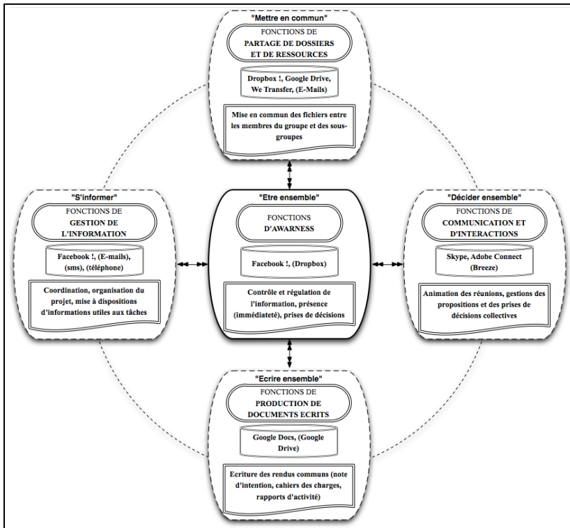
Figure 3 • Modélisation de l'environnement de travail des groupes

L'analyse a permis de mettre en évidence les rapports entre chacune des cinq fonctions, la place centrale qu'occupe la fonction d' awareness et fait ressortir la socialité portée par Facebook, déjà perçue lors de l'étude précédente (Peraya & Bonfils, 2012). De nombreux étudiants déclaraient en effet que Facebook était le moyen d'introduire de la convivialité, le fait « d'être ensemble », dans un univers professionnel : « Du point de vue de la dynamique de groupe, l'accent est mis sur les interactions sociales, sur la gestion de la relation et de la convivialité comme l'exprime le Groupe M1 CO malgré les caractéristiques authentiques et professionnalisantes du projet "Recherche de convivialité dans un contexte pro" (li 84) » (p. 37).