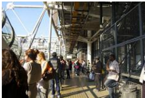
Espace nommé « coursive » :

L'ouverture d'un nouvel accès public au mois de juillet 2017 entre la coursive de la Bpi et la chenille du Centre Pompidou (escalator extérieur permettant de desservir les différents niveaux du bâtiment) s'est accompagnée d'une distribution de contremarques permettant aux usagers volontaires présents dans la bibliothèque de fréquenter gratuitement les espaces d'exposition du musée, espaces payants compris.