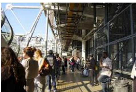
Espace nommé « coursive » :

L'ouverture d'un nouvel accès public au mois de juillet 2017 entre la coursive de la Bpi et la chenille du Centre Pompidou (escalator extérieur permettant de desservir les différents niveaux du bâtiment) s'est accompagnée d'une distribution de contremarques permettant aux usagers volontaires présents dans la bibliothèque de fréquenter gratuitement les espaces d'exposition du musée, espaces payants compris.