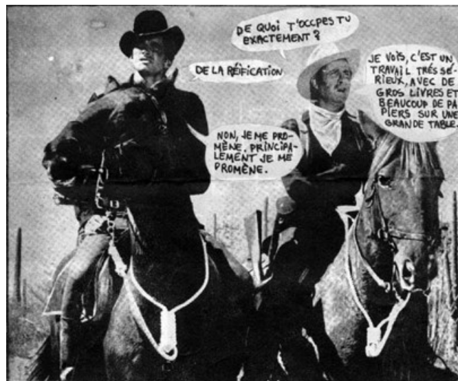
Le retour de la colonne Durruti, Internationale Situationniste, Octobre 1966.

Guy Ernest Debord, Rapport sur la construction des situations et sur les conditions de l'organisation et de l'action de la tendance situationniste internationale (Paris, 1957 – plaquette in-12, texte fondateur de l'Internationale Situationniste).