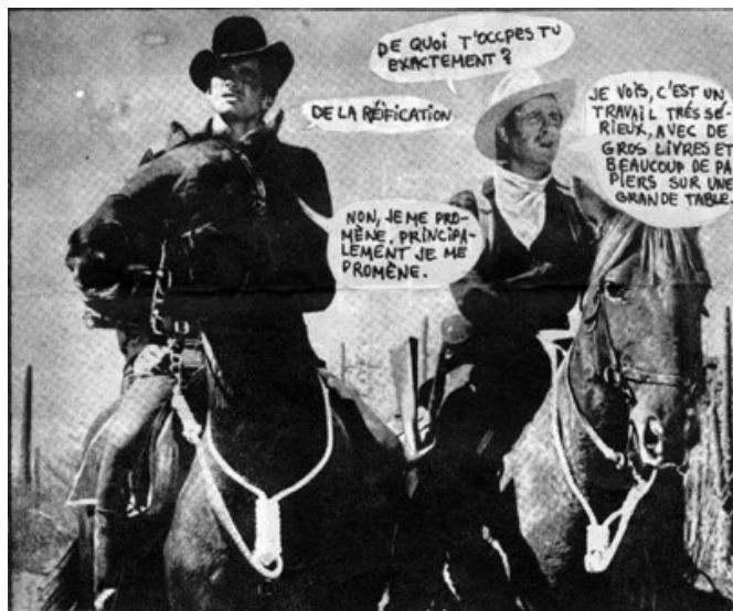
Le retour de la colonne Durruti, Internationale Situationniste, Octobre 1966.

Guy Ernest Debord, Rapport sur la construction des situations et sur les conditions de l'organisation et de l'action de la tendance situationniste internationale (Paris, 1957 – plaquette in-12, texte fondateur de l'Internationale Situationniste).