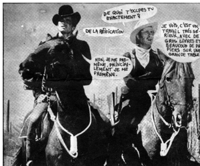
Le retour de la colonne Durruti, Internationale Situationniste, Octobre 1966.

Guy Ernest Debord, Rapport sur la construction des situations et sur les conditions de l'organisation et de l'action de la tendance situationniste internationale (Paris, 1957 – plaquette in-12, texte fondateur de l'Internationale Situationniste).