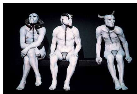
Die Antwoord : trailer de « SOS » (2012) Jane Alexander : The Butcher Boys (1985-1986)

Au niveau de la création artistique, D.A.W. est emblématique de la culture « after pop » qui se présente comme un savant mélange de références venues de la « haute » et de la « basse » culture. L'œuvre musicale de ce groupe s'ancre dans