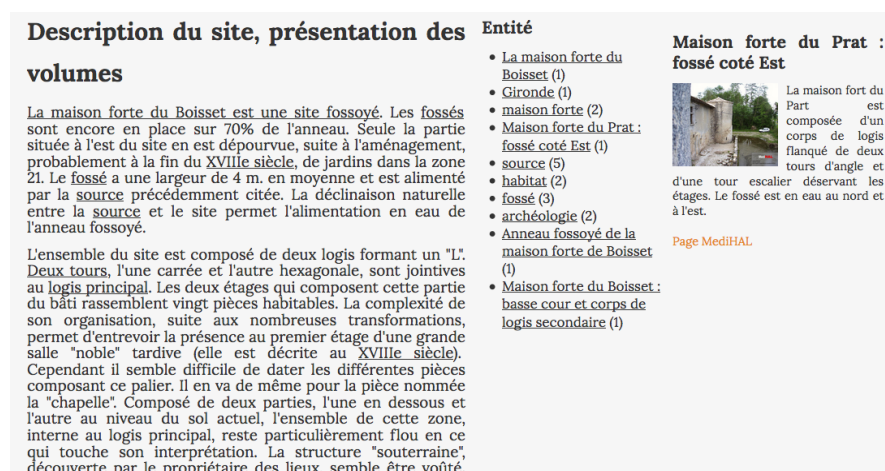
Figure 1.2. Preuve de concept d'enrichissement d'une page hypertexte

Grâce à ces nouvelles méthodes de liaison sémantique des fragments du web, de nouvelles possibilités d'enrichissement émergent. La TGI Adonis par exemple, offre une extension logicielle pour les carnets de recherche qui permet de proposer contextuellement de manière automatique des recommandations de contenus de la recherche (articles, thèses, chapitres, illustrations, etc.) tirés de la plate-forme Isidore et en lien direct avec le billet en cours [POU 16].