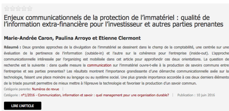
Figure X.1. Présentation des articles au sein de la rubrique « Articles »

popularité ou via un module recherche plein texte simple ou une recherche avancée. La présentation de ceux-ci reprend celle énoncée précédemment mais comprend également des éléments de paratexte afin notamment d'en assurer la traçabilité thématique.