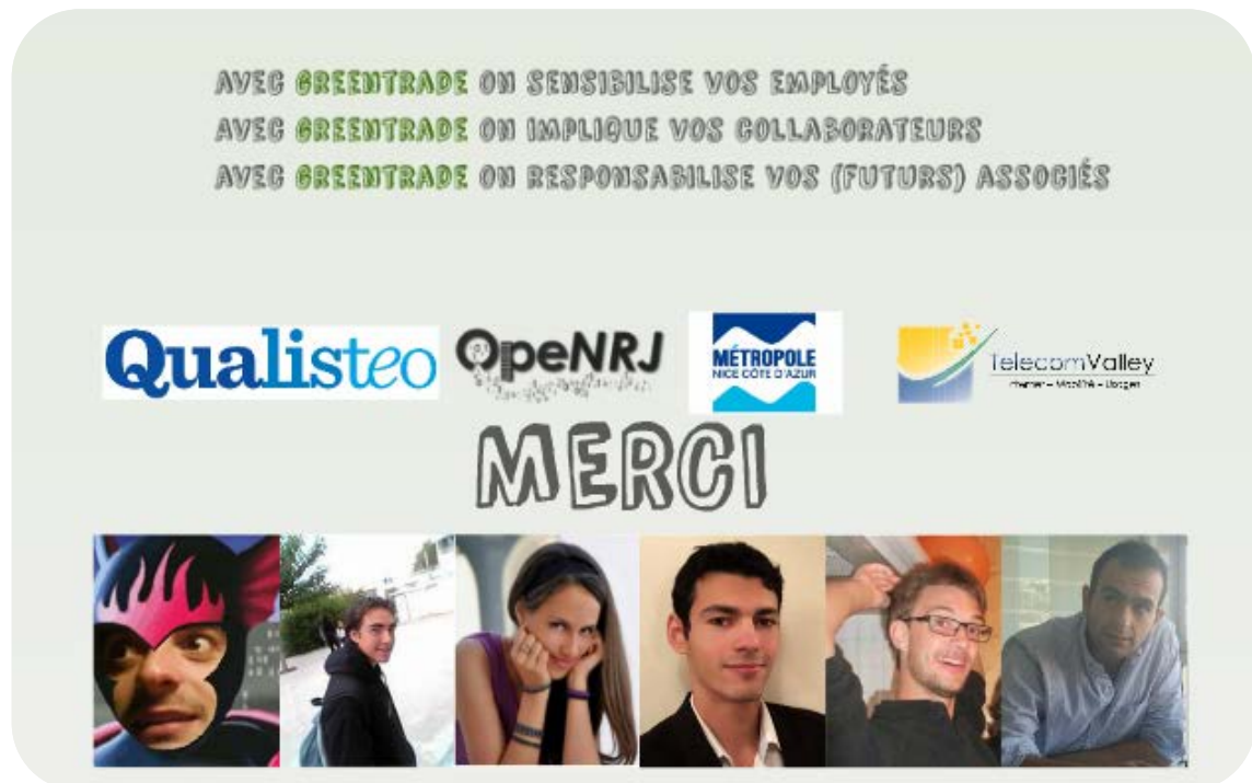
Figure 3 : Le concept Greentrade développé lors du Smart App Contest

L'équipe « GreenTrade » a été récompensée par le double Prix CASA/OpeNRJ/CSTB – Incubateur PACA Est/ENERGEIA.