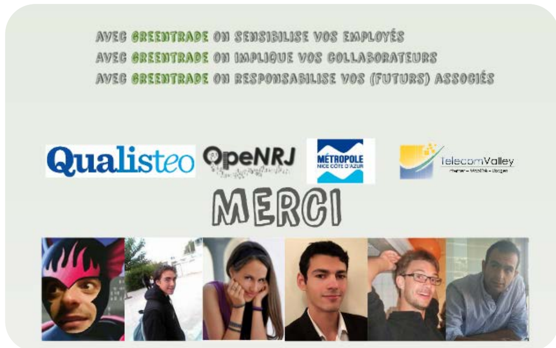
Figure 3 : Le concept Greentrade développé lors du Smart App Contest

L'équipe « GreenTrade » a été récompensée par le double Prix CASA/OpeNRJ/CSTB – Incubateur PACA Est/ENERGEIA.