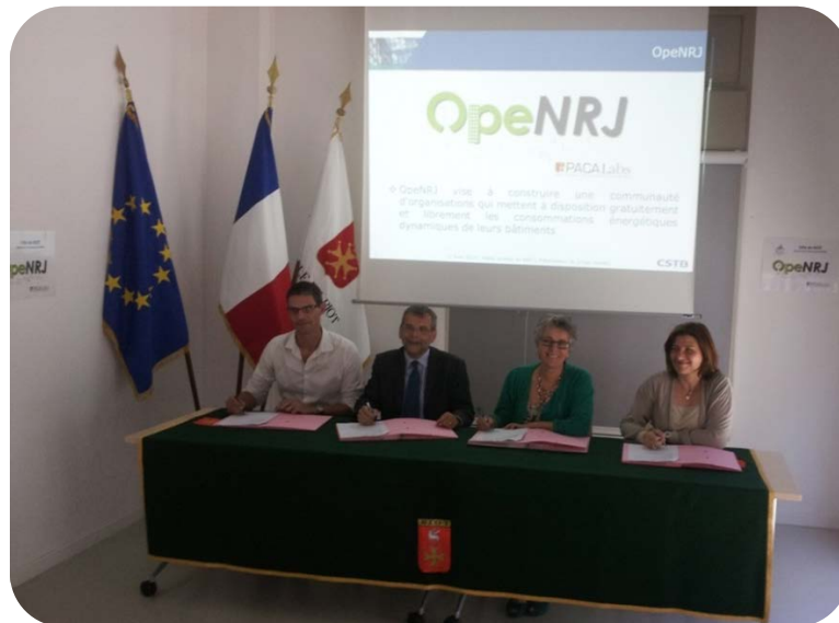
Figure 4 : Signature de la convention site pilote entre le consortium OpeNRJ et la ville de BIOT

Une demi-journée de restitution finale des résultats est en outre organisée le 30 Janvier 2015 au CSTB. Plus d'informations sont disponibles sur : http://openrj.eventbrite.com