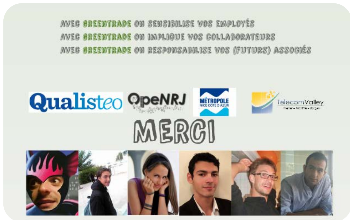
Figure 3 : Le concept Greentrade développé lors du Smart App Contest

L'équipe « GreenTrade » a été récompensée par le double Prix CASA/OpeNRJ/CSTB – Incubateur PACA Est/ENERGEIA.