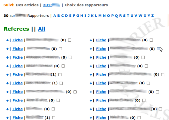
FIGURE 10. Liste des rapporteurs dans l'annuaire de Ruche