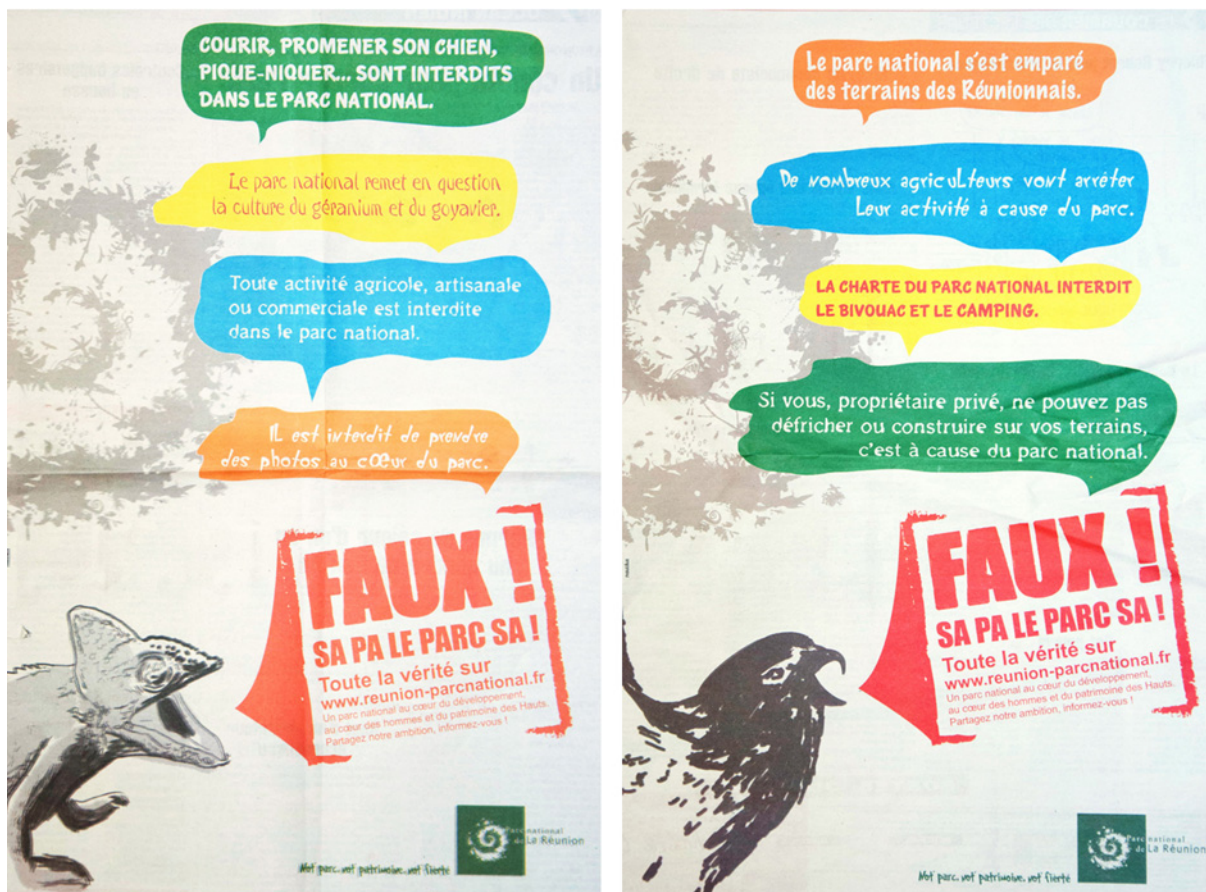
Figure 3 : Campagne de presse du parc national en 2013

Finalement la charte sera votée en 2013, après la procédure d'enquête publique qui clôt la discussion sur la charte et c'est le Conseil d'État qui la valide comme norme de gestion du cœur habité et de l'ensemble du territoire du parc. Des commissaires enquêteurs ont installé des permanences dans les mairies, et une interface web a été mise en place pour que les habitants, individuellement ou au nom de groupes constitués, donnent leur avis. Dans toute l'île de La Réunion, où habitent plus de 800000 personnes, moins de 100 avis ont été recueillis directement ou par mail. Le rapport des enquêteurs a estimé que cette participation citoyenne avait été largement insuffisante 30 .