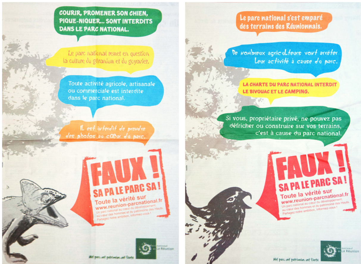
Figure 3 : Campagne de presse du parc national en 2013

Finally, the charter will be voted in 2013, after the public inquiry procedure which closes the discussion on the charter and it is the Council of State who validates it as a management norm of the inhabited heart and of the ensemble of the territory of the park. Des commissaires enquêteurs ont installé des permanences dans les mairies, et une interface web a été mise en place pour que les habitants, individuellement ou au nom de groupes constitués, donnent leur avis. Dans toute l'île de La Réunion, où habitent plus de 800000 personnes, moins de 100 avis ont été recueillis directement ou par mail. Le rapport des enquêteurs a estimé que cette participation citoyenne avait été largement insuffisante 30 .