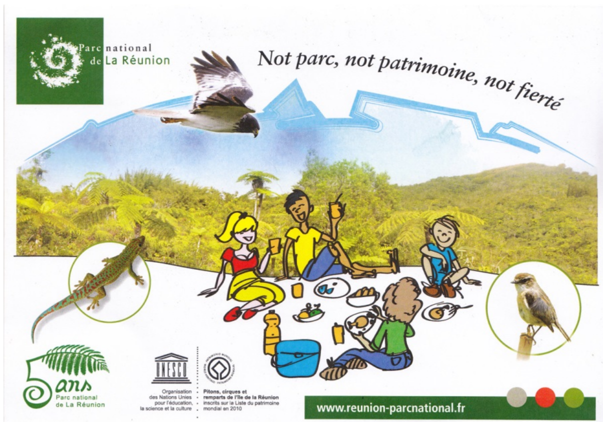
Figure 4 : Carte d'invitation du parc national

Le pique-nique, considéré à La Réunion comme une activité populaire traditionnelle, est ici nettement mis en avant dans l'iconographie : il vise à ancrer le parc dans une proximité avec les habitants. Cette opération était destinée à fêter l'anniversaire des cinq ans de la création du parc national, ainsi que celui des trois ans de son inscription sur la liste du patrimoine mondial.