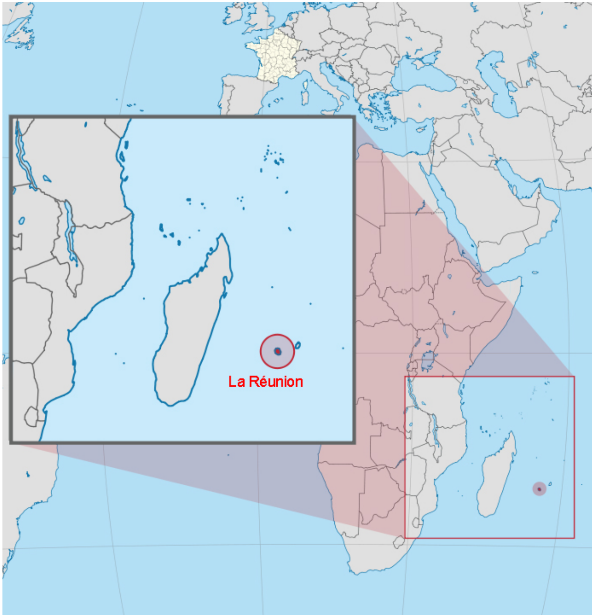
Figure 1: L'île de La Réunion. Carte adaptée de Wikipédia.