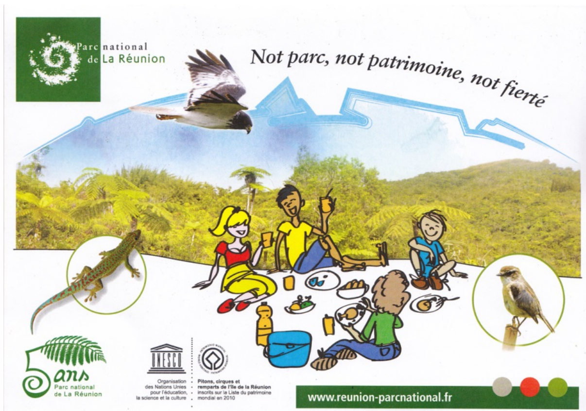
Figure 4 : Carte d'invitation du parc national

Le pique-nique, considéré à La Réunion comme une activité populaire traditionnelle, est ici nettement mis en avant dans l'iconographie : il vise à ancrer le parc dans une proximité avec les habitants. Cette opération était destinée à fêter l'anniversaire des cinq ans de la création du parc national, ainsi que celui des trois ans de son inscription sur la liste du patrimoine mondial.