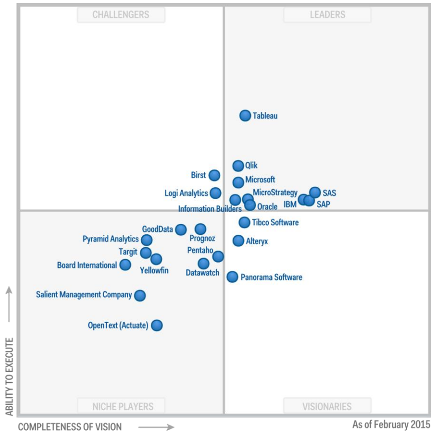
Figure 3 - Carré magique de Gartner pour la Business Intelligence et les plateformes analytiques