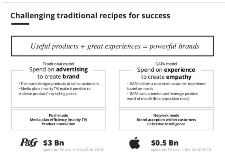
Figure 1 - La recette du succès

La stratégie a une base planétaire, les services qui sont développés sont ceux qui intéressent des millions de personnes, la base client est toujours pensée au niveau international et permet d'envisager que le gratuit va finir par s'équilibrer avec un seuil minime de ventes par client doublé par les revenus publicitaires d'une région internationale.