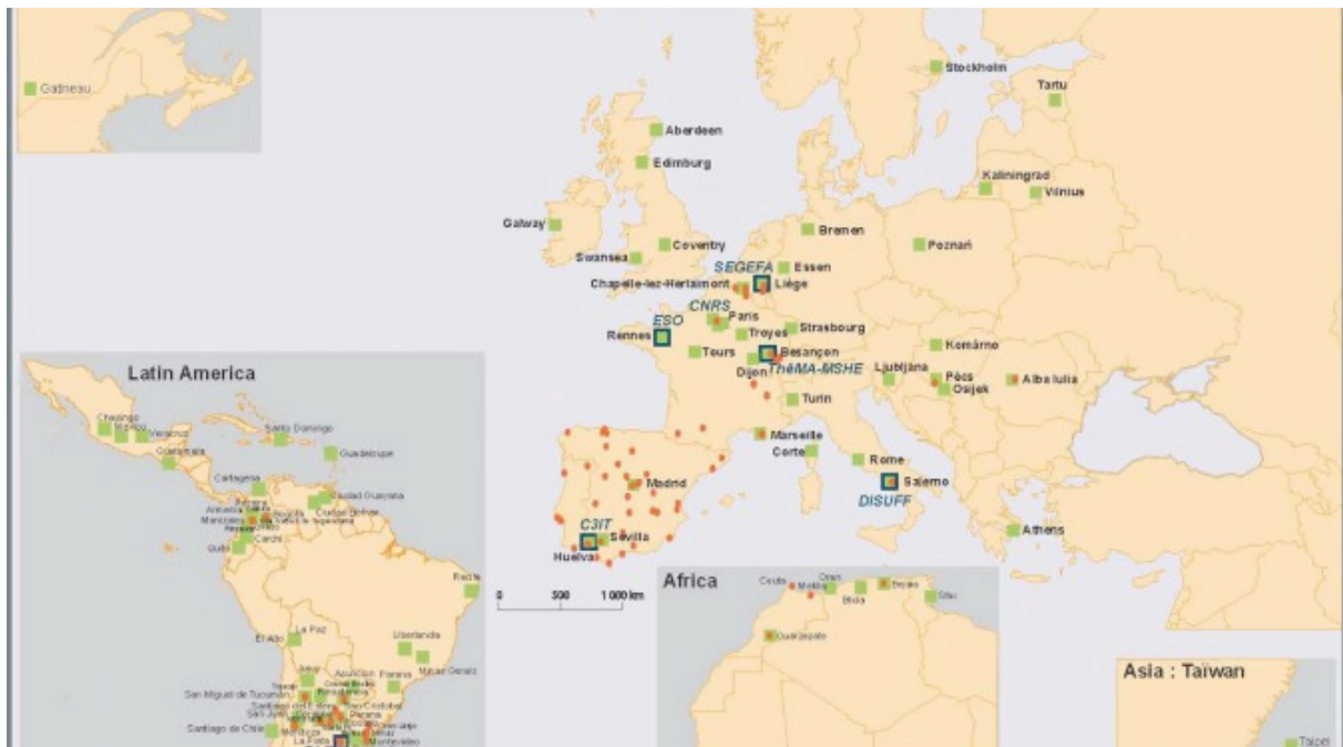
Carte N°1 : Extension du réseau Inti (International Network of Territorial Intelligence)