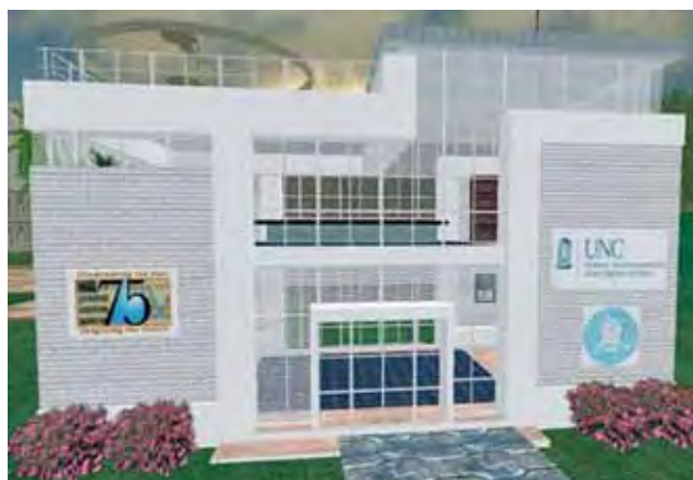
La BU sur Second Life.

navigate avec des outils qui ne sont pas traditionnellement ceux des bibliothécaires, la nouvelle bibliothèque doit oublier ses vieux réflexes d'encyclopédisme, d'exhaustivité, de patrimonialisation et de stock pour entrer de plain pied dans l'univers des flux. D'une part, elle doit gérer sa visibilité. L'usager est né dans un monde à la Google, il est plus familier de Youtube, Myspace et MSN que des OPAC et des catalogues collectifs : qu'à cela ne tienne, la bibliothèque doit faire son « branding », comme disent nos voisins, s'inviter dans le monde virtuel de ses utilisateurs. C'est ce que fait l'EPFL en « customisant » Google Scholar ; c'est dans une autre dimension la création de bibliothèques virtuelles sur Info Island de Second Life 6 .