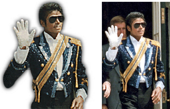
Figure 4 : Une photographie plus authentique

Dans la même logique, (37) supprime de la biographie le terme superstar.