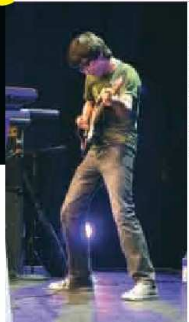
Britney Remix : lancement de la revue Poli

Cette impression de partager quelque chose dans la joie tient à la présence du conférencier, vers lequel convergent tous les regards. Il est perçu comme tout à la fois recelant un savoir précieux et invitant à communier autour de la connaissance. Le plaisir consiste précisément à expérimenter cela à plusieurs, dans l'ombre: « sur la scène... ils sont tous tellement intelligents... » Ce bonheur est redoublé, lorsque le conférencier est un chercheur ou un auteur célèbre: « On vient par intérêt, en voyeur. »