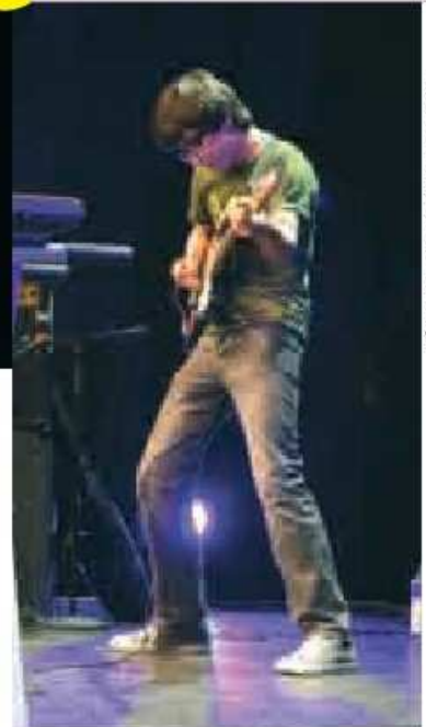
Britney Remix : lancement de la revue Poli

Cette impression de partager quelque chose dans la joie tient à la présence du conférencier, vers lequel convergent tous les regards. Il est perçu comme tout à la fois recelant un savoir précieux et invitant à communier autour de la connaissance. Le plaisir consiste précisément à expérimenter cela à plusieurs, dans l'ombre: « sur la scène... ils sont tous tellement intelligents... » Ce bonheur est redoublé, lorsque le conférencier est un chercheur ou un auteur célèbre: « On vient par intérêt, en voyeur. »