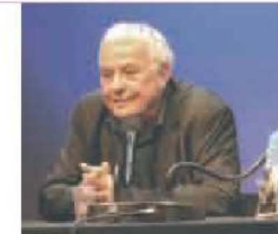
Philippe Sollers (cycle Écrire, écrire, pourquoi? )