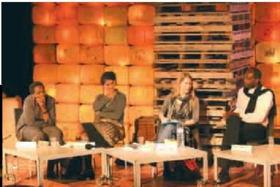
L'Afrique si près si loin, (Rencontres D'encre et d'exil)

« C'est finalement cela que je cherche et qui m'intéresse dans les conférences, le fait que certaines personnes très expertes viennent faire partager leurs connaissances et leur amour d'un domaine avec le grand public. » Le conférencier se voit confier la mission de « faire d'un sujet complexe, une conférence tout à fait abordable ». Il doit pouvoir présenter une synthèse à l'auditoire, permettre à ceux qui viennent l'entendre de s'économiser (« ça évite de lire des gros livres »), tout en pénétrant une pensée qui, sans « mots clefs », resterait inaccessible.