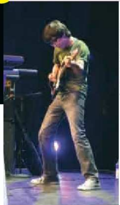
Britney Remix : lancement de la revue Poli

Cette impression de partager quelque chose dans la joie tient à la présence du conférencier, vers lequel convergent tous les regards. Il est perçu comme tout à la fois recelant un savoir précieux et invitant à communier autour de la connaissance. Le plaisir consiste précisément à expérimenter cela à plusieurs, dans l'ombre: « sur la scène... ils sont tous tellement intelligents... » Ce bonheur est redoublé, lorsque le conférencier est un chercheur ou un auteur célèbre: « On vient par intérêt, en voyeur. »