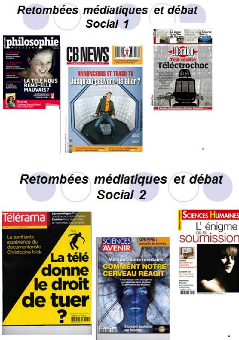
Figure 1 : Quelques retombées médiatiques et sociales du documentaire et de la recherche

Les objectifs et le « temps médiatiques » n'étant pas les mêmes que ceux de la recherche scientifique, les résultats n'ont été publiés que récemment, après expertises par les pairs (2). L'objectif de cette communication, effectuée par les responsables scientifiques de l'expérimentation, est double. Il s'agit, premièrement, de présenter, pour la première fois en SIC, une courte synthèse des principaux apports empiriques. Deuxièmement, l'objectif est d'apporter d'autres résultats, notamment ceux issus d'une nouvelle étude empirique plus récemment menée par l'un d'entre nous et destinée à mieux comprendre les comportements des joueurs face à des caméras sur un plateau de télévision.