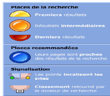
2 : légende