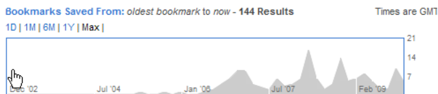
Figure 4. Utilisation du tag « library 2.0 » sur delicious