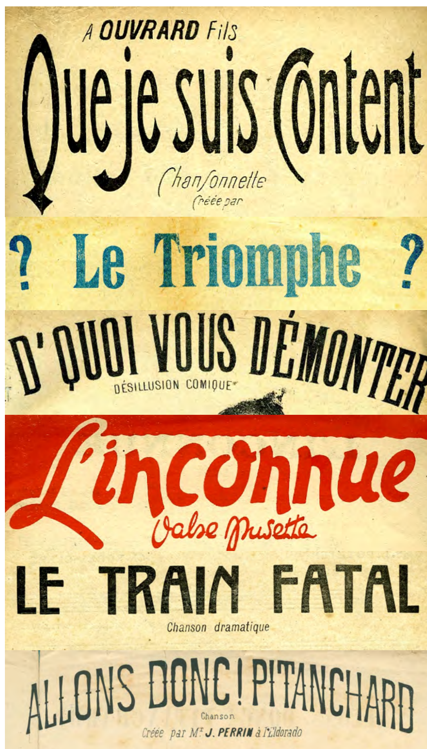
Ill. 1. Lorsque les chercheurs apprennent qu'ils sont « connus de Hal », serveur d'archives ouvertes, par des références bibliographiques déposées à l'insu de leur plein gré, leurs impressions sont paradoxales, allant du contentement à la colère, en passant par le doute envers l'annonceur de l'information. [Ch. 2 à 7]