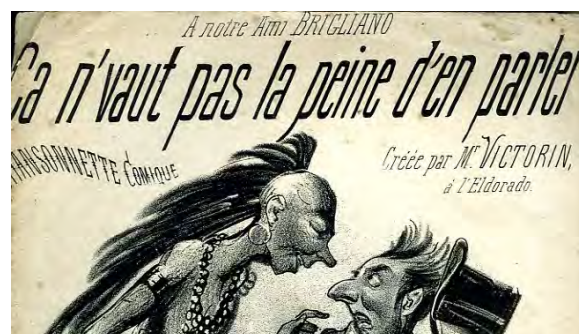
Ill. 15. Mais parlons-en quand même... [Ch. 36].