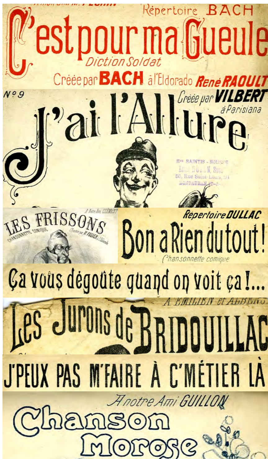
Ill. 10. Lorsque les chercheurs découvrent qu'ils sont présents sur une archive ouverte avec des références bibliographiques, ils n'en sont guère contents. [Ch. 32 à 39]