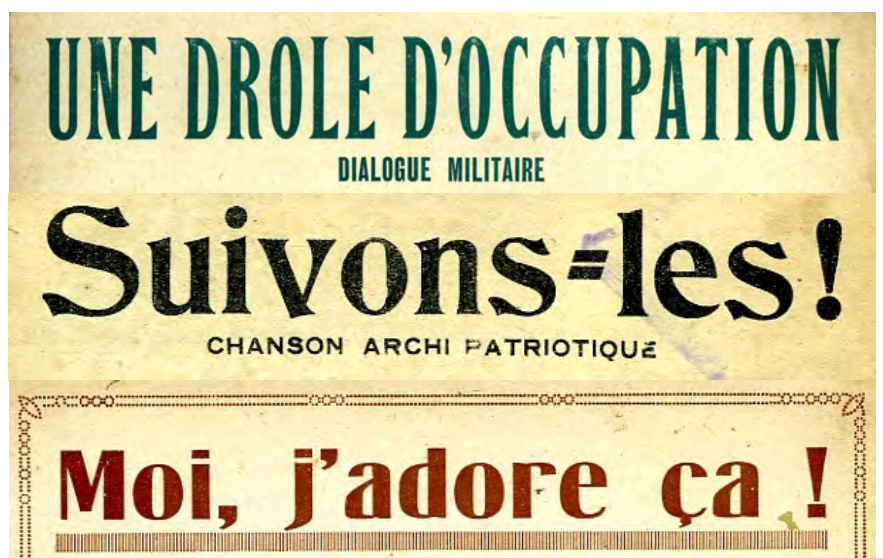
Ill. 6. La consultation des informations mises en disponibles sur Internet permet désormais de suivre les publications des collègues-concurrents. Google Scholar et autres évaluateurs bibliométriques encouragent à consulter les scores « index citations ». [Ch. 16 à 18]

Google scholar archives-ouvertes.fr [PDF] © Google