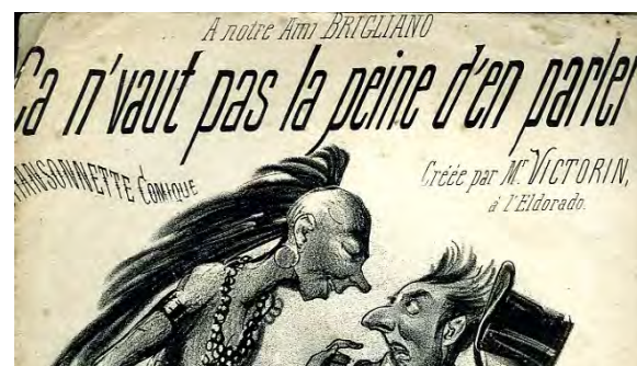
Ill. 15. Mais parlons-en quand même... [Ch. 36].