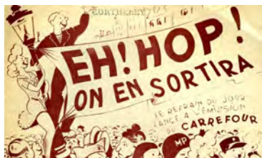
Ill. 16. [Ch. 56]

Ugène Déhaire-Déheu trouvera-t-il un moyen de ne plus être « connu de Hal » ? Va-t-il faire son entrée en archives ouvertes en « true » ? Mais pourquoi le TGE-Adonis CNRS-INSHS Adonis n'est pas dans cette histoire ?