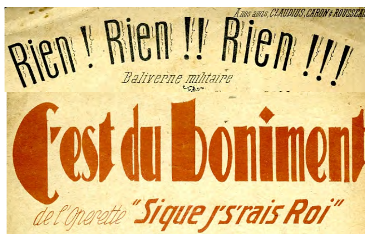
Ill. 4. Une recherche superficielle sur Hal peut donner l'impression aux auteurs qu'ils ne sont pas connus de Hal, alors qu'en réalité de nombreuses notices bibliographiques ont été déposées pour eux. [Ch. 12 et 13]

« Auteur (nom) est exactement », je tape mon nom, ça, je sais faire. Attention aux accents ! Voilà, c'est bon. Qu'est-ce que j'obtiens comme réponses ? Mais qu'est-ce qu'il m'a raconté, cet imbécile, j'y suis même pas !