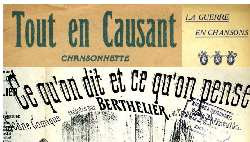
Ill. 14. Comme dans tous les secteurs de travail, les échanges professionnels directs entre gens de la recherche sont codifiés, et doivent afficher une courtoisie de bon aloi dans leurs modes d'adresse. Les potins échangés hors-présence des concernés montrent souvent un décalage dans le mode de référence. [Ch. 52 à 54]