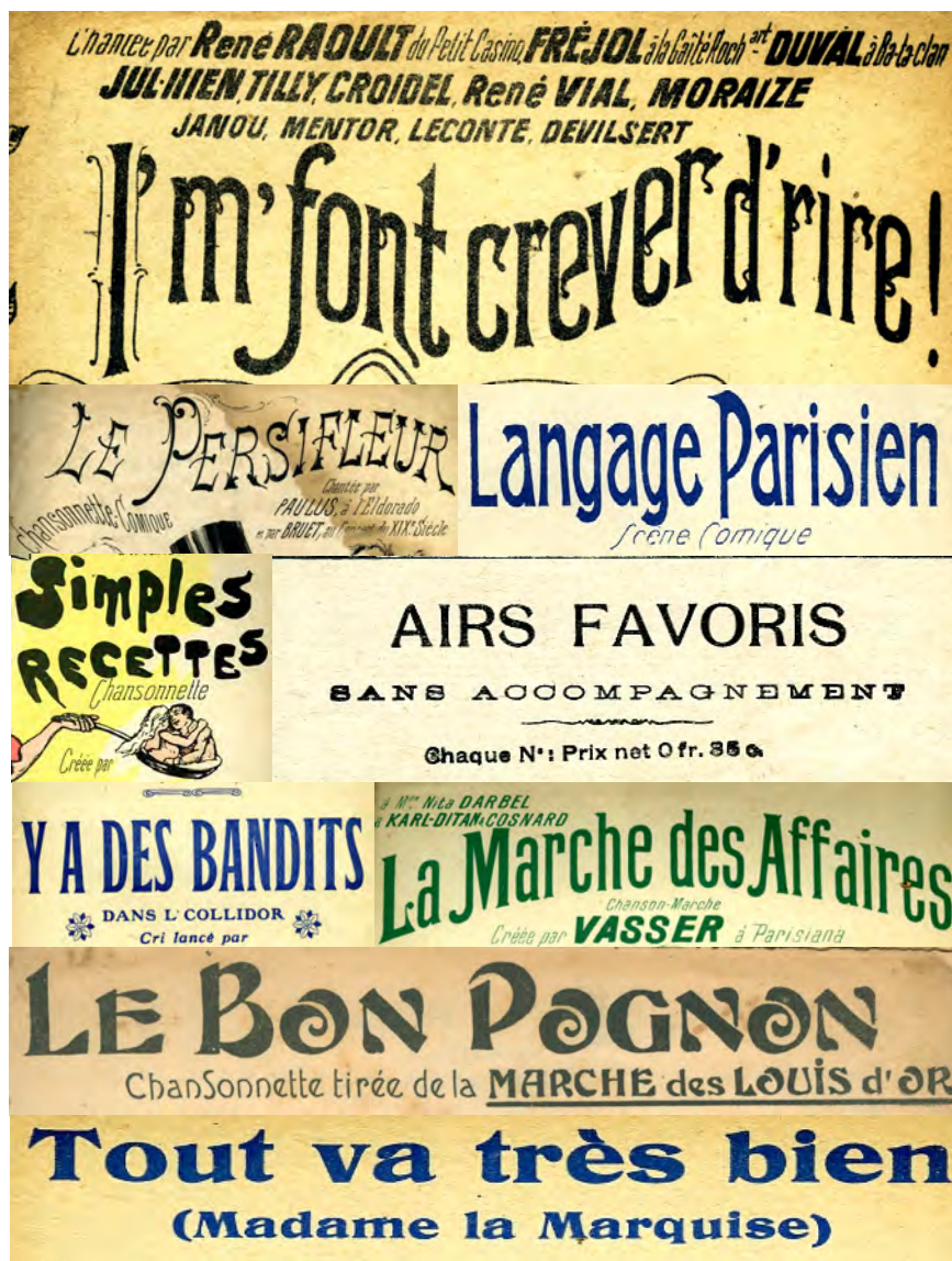
Ill. 7. Le rire est un moyen de résistance des dominés. Le dépôt en archives ouvertes des documents en version auteur est un moyen de faire connaître son travail réel, au-delà des attributions scientifiques hiérarchiques. Les contributeurs en situation précaire ou sous-qualifiés ont saisi l'opportunité des archives ouvertes pour rendre lisibles leurs travaux, ce qui met en lumière quelques dysfonctionnements des SHS tolérés par la collectivité. [Ch. 19 à 27]