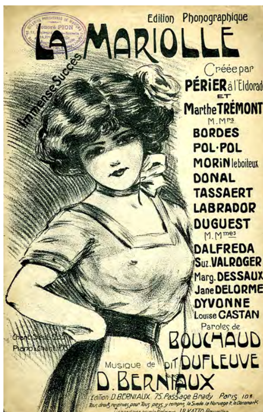
Ill. 17. [Ch. 57]

Vous le saurez peut-être en lisant les prochains épisodes de leurs aventures dans le supplément électronique de la VRS.