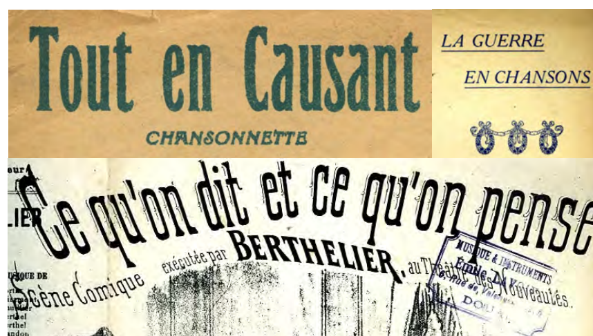
Ill. 14. Comme dans tous les secteurs de travail, les échanges professionnels directs entre gens de la recherche sont codifiés, et doivent afficher une courtoisie de bon aloi dans leurs modes d'adresse. Les potins échangés hors-présence des concernés montrent souvent un décalage dans le mode de référence. [Ch. 52 à 54]