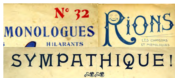
Ill. 2. L'exécution d'une tâche sur un ordinateur s'accompagne d'une succession de pensées, verbalisées ou non, conscientes ou non. [Ch. 8 à 10]

Déhaire-Déheu retourne chez lui et se précipite sur son ordinateur. Devant l'écran.