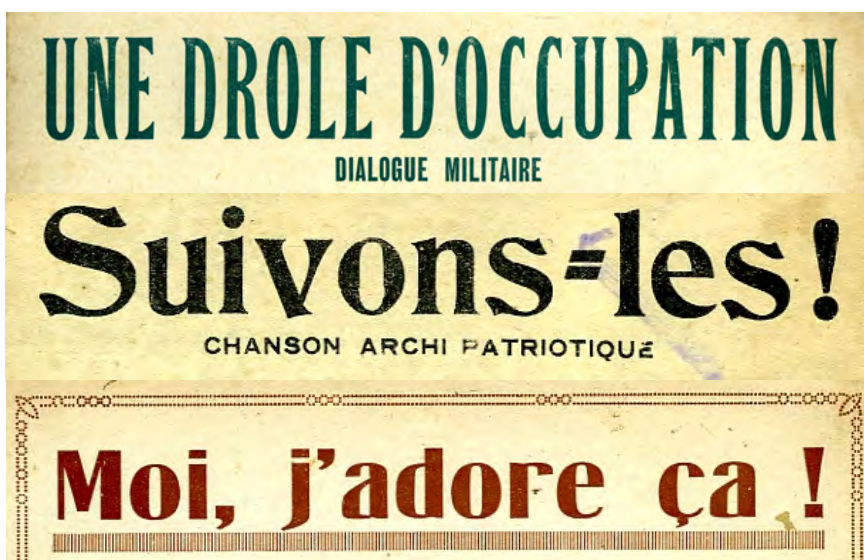
Ill. 6. La consultation des informations mises en disponibles sur Internet permet désormais de suivre les publications des collègues-concurrents. Google Scholar et autres évaluateurs bibliométriques encouragent à consulter les scores « index citations ». [Ch. 16 à 18]

Google scholar archives-ouvertes.fr [PDF]