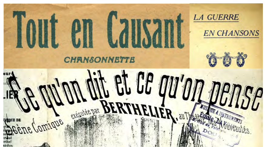
Ill. 14. Comme dans tous les secteurs de travail, les échanges professionnels directs entre gens de la recherche sont codifiés, et doivent afficher une courtoisie de bon aloi dans leurs modes d'adresse. Les potins échangés hors-présence des concernés montrent souvent un décalage dans le mode de référence. [Ch. 52 à 54]