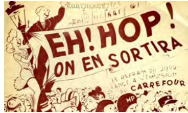
Ill. 16. [Ch. 56]

Ugène Déhaire-Déheu trouvera-t-il un moyen de ne plus être « connu de Hal » ? Va-t-il faire son entrée en archives ouvertes en « true » ? Mais pourquoi le TGE-Adonis CNRS-INSHS Adonis n'est pas dans cette histoire ?