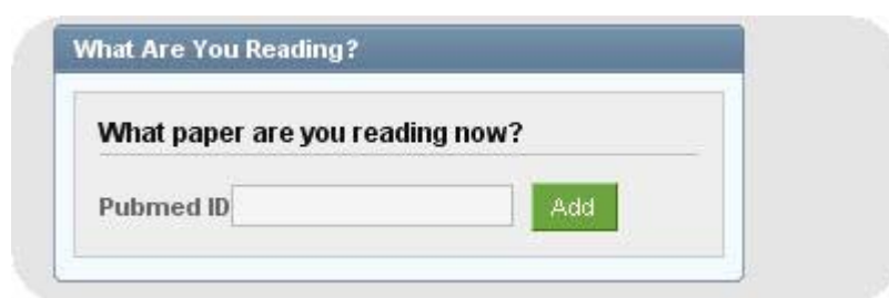
Figure 2. Mention de la lecture en cours sur SciLink

Le réseau SciLink fait état de 43 368 inscrits 12 Cependant, ces réseaux connaissent peu d'activités, finalement un peu comme les plates-formes de partage de références dédiées aux articles scientifiques tels Connotea qui contiennent moins de références d'articles que Delicious . Il semble que les réseaux généralistes types Facebook soient davantage utilisés par les scientifiques. Nous remarquons d'ailleurs sur la plate-forme SciLink , l'importation de fonctionnalités type Facebook comme le montre la figure ci-dessous.