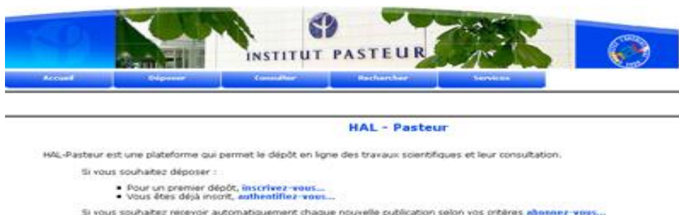
Figure 6 – Le portail HAL-Pasteur sur la plate-forme HAL 52

Dans une seconde phase de développement, plusieurs établissements ont exprimé le désir de mettre en place une archive institutionnelle pour accroître la visibilité de leur production scientifique. A partir d'une archive unique pour les chercheurs, HAL a été transformée en une plate-forme modulaire qui permet à n'importe quel établissement ou laboratoire de créer sa propre collection virtuelle ou sa propre interface de dépôt et consultation (Figure 6), éventuellement avec un processus personnalisé de validation des documents. Les archives institutionnelles créées sur la plate-forme HAL représentent un faible investissement pour les établissements, essentiellement lié au processus éditorial, et ils bénéficient ainsi de l'expérience et du soutien de l'équipe de la plate-forme commune. Cependant, les documents, pour être déposés dans une collection virtuelle de HAL doivent être conformes à la politique de sélection des documents de HAL. Le dépôt ne peut concerner qu'un article ou un document scientifique similaire à un article. Un support de présentation (ex. Powerpoint) ou une collection d'images ne peuvent être déposés que comme annexes à un document de type article scientifique.