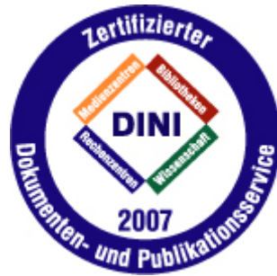
Figure 2 – Certificat DINI

En plus des archives institutionnelles mises en place par les établissements de recherche pour rendre plus visible leur production scientifique, de nombreuses initiatives et projets gèrent des archives dites disciplinaires, par exemple Math-Net, Phys-Net, la IuK-Initiative des sociétés savantes allemandes, ainsi que les bibliothèques virtuelles disciplinaires financées par la DFG. L’articulation entre archives institutionnelles et disciplinaires est un sujet de discussion de plus en plus important.