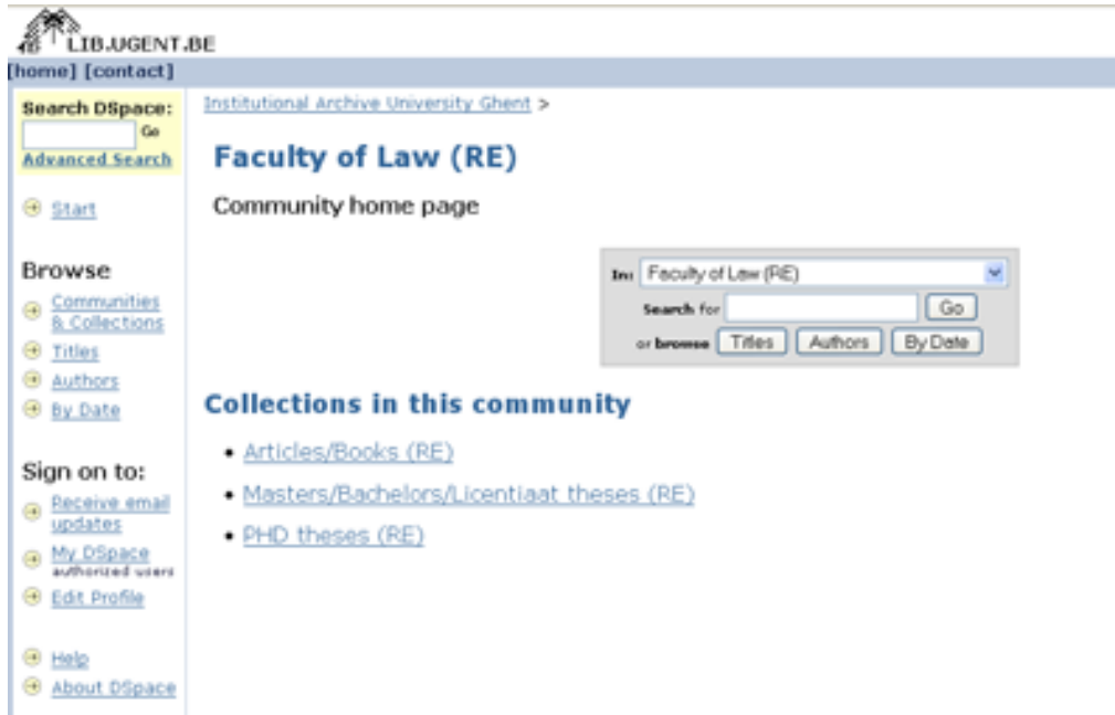
Figure 7 – Archive de l'Université de Gand 58

Gand avait une archive fonctionnelle avec environ 2000 articles et thèses en libre accès 57 (Figure 7). L'archive était compatible OAI-PMH, et quelques établissements venaient de créer leur propre archive (la National Marine Science Institution, l'Université de Hasselt, le portail des thèses électroniques de la communauté francophone). La première tâche de l'équipe DRIVER a consisté à contacter tous les gestionnaires d'archives potentiels et les « bibliothécaires numériques » des établissements de recherche et d'enseignement supérieur, afin de déterminer leur intérêt pour la création d'une archive dans leur établissement. Des questionnaires sommaires ont été distribués. Ils ont révélé que nombreux étaient ceux qui avaient envisagé la création d'une archive mais manquaient du soutien politique et financier de leur administration.