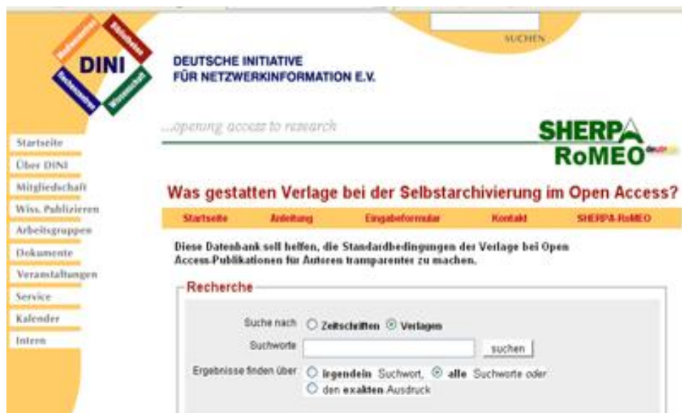
Figure 5 – Le portail du Libre accès DINI utilise le service ROMEIO/SHERPA 44

ROMEIO/SHERPA voire l'intègrent à leur environnement via son service Web (Figure 5). Il permet aux chercheurs de savoir si leur éditeur leur permet ou non de déposer la publication dans une archive.