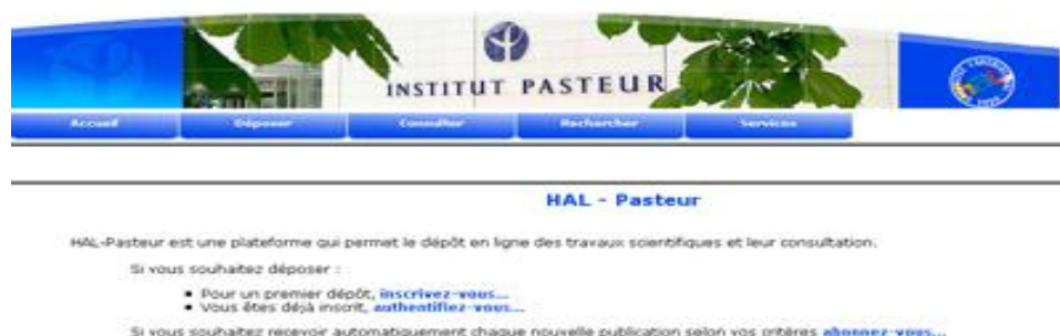
Figure 6 – Le portail HAL-Pasteur sur la plate-forme HAL 52

Dans une seconde phase de développement, plusieurs établissements ont exprimé le désir de mettre en place une archive institutionnelle pour accroître la visibilité de leur production scientifique. A partir d'une archive unique pour les chercheurs, HAL a été transformée en une plate-forme modulaire qui permet à n'importe quel établissement ou laboratoire de créer sa propre collection virtuelle ou sa propre interface de dépôt et consultation (Figure 6), éventuellement avec un processus personnalisé de validation des documents. Les archives institutionnelles créées sur la plate-forme HAL représentent un faible investissement pour les établissements, essentiellement lié au processus éditorial, et ils bénéficient ainsi de l'expérience et du soutien de l'équipe de la plate-forme commune. Cependant, les documents, pour être déposés dans une collection virtuelle de HAL doivent être conformes à la politique de sélection des documents de HAL. Le dépôt ne peut concerner qu'un article ou un document scientifique similaire à un article. Un support de présentation (ex. Powerpoint) ou une collection d'images ne peuvent être déposés que comme annexes à un document de type article scientifique.