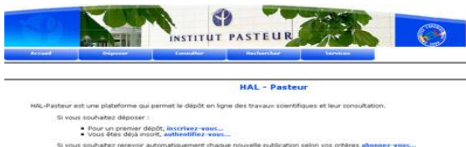
Figure 6 – Le portail HAL-Pasteur sur la plate-forme HAL 52

Dans une seconde phase de développement, plusieurs établissements ont exprimé le désir de mettre en place une archive institutionnelle pour accroître la visibilité de leur production scientifique. A partir d'une archive unique pour les chercheurs, HAL a été transformée en une plate-forme modulaire qui permet à n'importe quel établissement ou laboratoire de créer sa propre collection virtuelle ou sa propre interface de dépôt et consultation (Figure 6), éventuellement avec un processus personnalisé de validation des documents. Les archives institutionnelles créées sur la plate-forme HAL représentent un faible investissement pour les établissements, essentiellement lié au processus éditorial, et ils bénéficient ainsi de l'expérience et du soutien de l'équipe de la plate-forme commune. Cependant, les documents, pour être déposés dans une collection virtuelle de HAL doivent être conformes à la politique de sélection des documents de HAL. Le dépôt ne peut concerner qu'un article ou un document scientifique similaire à un article. Un support de présentation (ex. Powerpoint) ou une collection d'images ne peuvent être déposés que comme annexes à un document de type article scientifique.