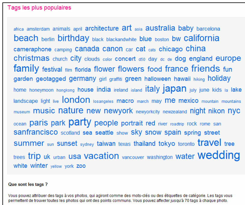
Fig. 1. L'exemple d'une folksonomie générale du site de partage de photos Flickr.

C'est dans la conception participative et distribuée du système d'indexation permettant d'accéder aux ressources informationnelles (la folksonomie) que s'exerce la gouvernance éditoriale. Les contributeurs caractérisent eux-mêmes les ressources qu'ils mettent en partage en puisant dans les mots-clefs créés par la communauté et en tenant compte du degré de popularité de ces annotations. L'utilisation de ces méthodes d'indexation participative dans le contexte de la documentation professionnelle serait porteuse d'un fort potentiel d'hybridation bien qu'elles soient considérées par certains spécialistes de la documentation comme comportant un risque de déstructuration profonde des systèmes d'organisation des connaissances qu'ils mettent au point. Plusieurs auteurs, dont nous faisons partie (Ertzscheid et Gallezot, 2006, Zacklad 2007d), considèrent pourtant qu'en mixant indexation spécialisée réalisée par des professionnels et indexation participative, on disposerait d'un compromis très performant en termes de couverture thématique et d'évolutivité.