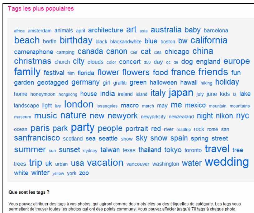
Fig. 1. L'exemple d'une folksonomie générale du site de partage de photos Flickr.

C'est dans la conception participative et distribuée du système d'indexation permettant d'accéder aux ressources informationnelles (la folksonomie) que s'exerce la gouvernance éditoriale. Les contributeurs caractérisent eux-mêmes les ressources qu'ils mettent en partage en puisant dans les mots-clefs créés par la communauté et en tenant compte du degré de popularité de ces annotations. L'utilisation de ces méthodes d'indexation participative dans le contexte de la documentation professionnelle serait porteuse d'un fort potentiel d'hybridation bien qu'elles soient considérées par certains spécialistes de la documentation comme comportant un risque de déstructuration profonde des systèmes d'organisation des connaissances qu'ils mettent au point. Plusieurs auteurs, dont nous faisons partie (Ertzscheid et Gallezot, 2006, Zacklad 2007d), considèrent pourtant qu'en mixant indexation spécialisée réalisée par des professionnels et indexation participative, on disposerait d'un compromis très performant en termes de couverture thématique et d'évolutivité.