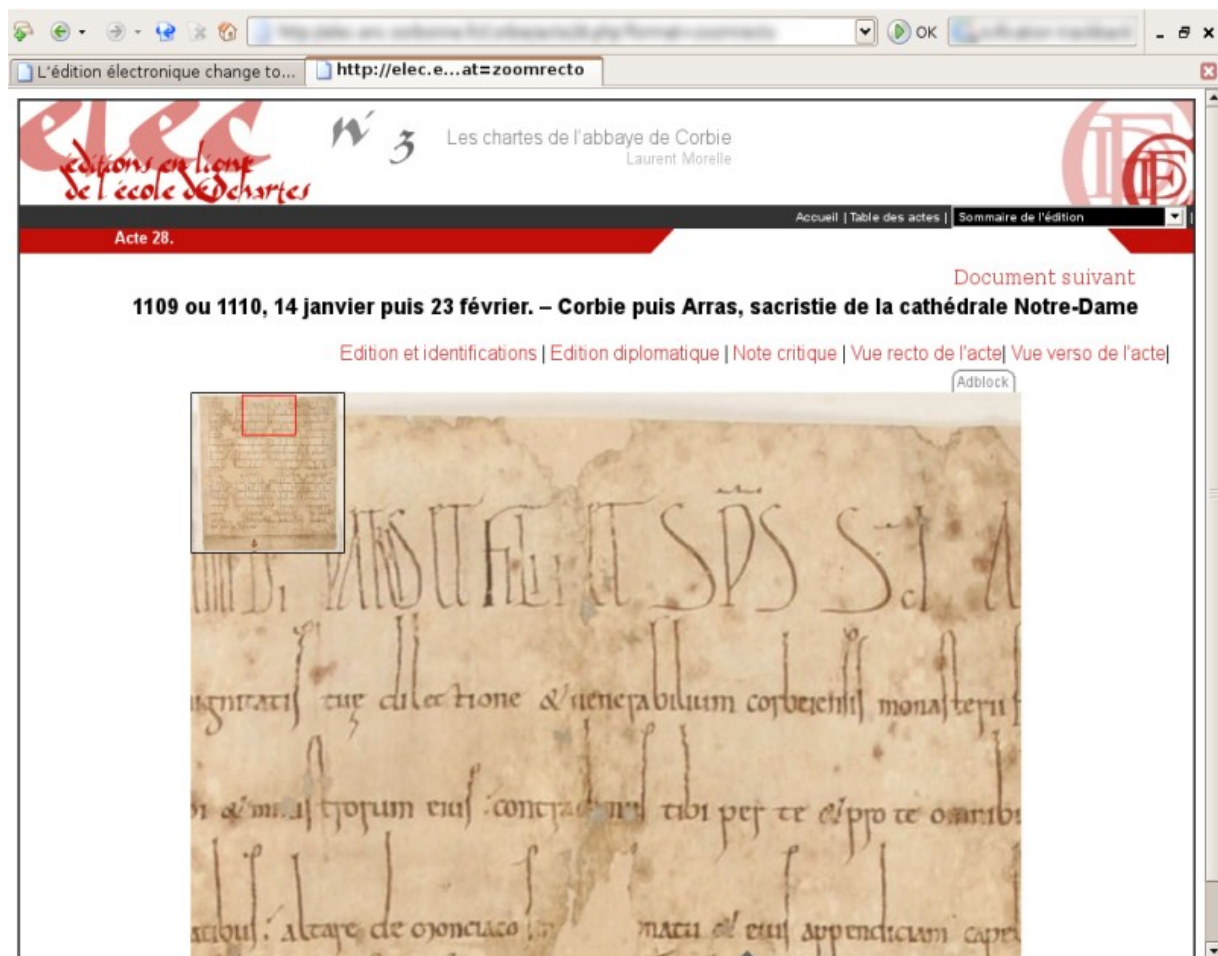
Copie d'écran de la page permettant de zoomer sur la numérisation d'un acte dans le projet d'édition des chartes de l'abbaye de Corbie.

Dans le cadre des éditions critiques, l'apport fondamental est constitué par la rapidité d'accès à l'information grâce aux tables chronologiques des actes générées automatiquement à partir du balisage, aux cartes géographiques ou bien-entendu à la recherche en texte intégral, rendue possible par le balisage du texte, qui pour l'instant est proposée sans lemmatisation, comme le montrent les exemples du cartulaire blanc de l'abbaye de Saint-Denis 15 ou du projet de numérisation des éditions de cartulaires d'Île-de-France 16 . De plus, l'édition électronique, dont le coût n'est pas proportionnel au nombre de pages de l'édition permet de proposer plusieurs aperçus d'un même acte et ainsi régler la querelle entre les tenants de l'édition critique et de l'édition imitative.