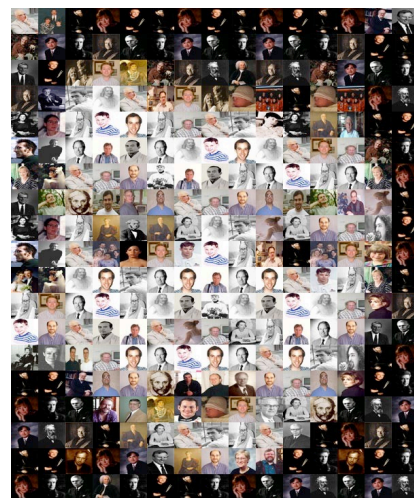
Frag2. Fragmentation importante et transparence

Les deux images mosaïques ci-dessus illustrent des variations possibles de ce processus - leur rendu témoignant d'un des nombreux paramétrages possible de l'application. Il s'agit ici