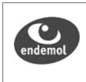
Figure 22 Le logo de l'entreprise Endemol, un œil stylisé et sévère ( http://www.endemol.com )

leur choix de cliché non sur l'humanité de la situation mais sur le seul souci du spectacle (Figure 23, 24, 25 et 26). Cela donne un monde d'images étranges, d'où la contre-plongée et la profondeur de champ sont exclus (on se rappelle que, quand les caméras sont montrées, elles le sont inclinées vers le bas), peuplé d'animaux solitaires dont on capte les mœurs humaines.