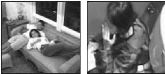
Figures 27 et 28

en effet, même si c'est pour jouer. La seule composition de l'image contient tout entière les règles du jeu - tel l'hologramme qui, déchiré, « contient » encore tout le cliché.