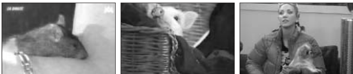
Figures 7, 8 et 9. Compagnons d'infortune : rat, cochon, chihuahua ( http://www.ratz-story.fr.st , http://www.bigbrother.de/BB3/cgi-bin/content.cgi?bew=Konrad , http://vip.bigbrother.vnet.hu/content/pics/2003_4/NDQ3OQ_3D_3D_1.jpg )

Les candidats, soigneusement triés sur le volet par une équipe de production qui recherche des personnages à la hauteur de leur stéréotype, sont jeunes, sveltes, beaux et attractifs. À l'image, il fallait s'y attendre, les corps sont volontiers montrés : les garçons se pavanent torsés nus et en short, les filles se dandinent dans des vêtements moulants