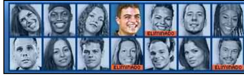
Figure 1, 2, 3 et 4. Trombinoscopes suédois, argentin, américain et brésilien

( http://www.bigbrother.se/ , http://www.granhermano.com/galeria/galeria1.htm , http://www.cbs.com/primetime/bigbrother3/houseguests/index.shtml , http://bbb.globo.com/ )