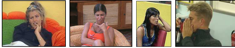
Figure 23, 24, 25 et 26. Portraits « morts » : en légère plongée, des expressions stéréotypées, des clichés volés, des cadrages inaccoutumés ( http://www.bigbrother.de/BB3/index.htm , http://www.terra.com.ar/canales/gh3/62/62051.html , http://bbb.globo.com/BBB3/0,6993,BGI1-2527-GN1-3221325454---0,00.html , http://www.bigbrother.de/BB2/index.htm )