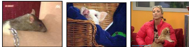
Figures 7, 8 et 9. Compagnons d'infortune : rat, cochon, chihuahua ( http://www.ratz-story.fr.st , http://www.bigbrother.de/BB3/cgi-bin/content.cgi?bew=Konrad , http://vip.bigbrother.vnet.hu/content/pics/2003_4/NDQ3OQ_3D_3D_1.jpg )