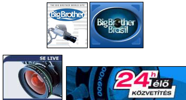
Figures 12, 13, 14 et 15. La caméra de surveillance, un motif quasi-identitaire ( http://www.bigbrotherworld.tv/page_low.htm , http://bbb.globo.com/ , http://www.bigbrother.se/ , http://www.bigbrother.vnet.hu/ )

Quelle que soit la langue ou la culture, c'est le regard « panoptique » qui prédomine – pour reprendre la proposition de Bentham popularisée par Foucault d'une société où le regard sur autrui est aussi incessant qu'impersonnel : « en apparence, ce n'est que la solution d'un problème technique ; mais à travers elle, tout un type de société se dessine » 13 . On aurait pu s'y attendre : le dispositif de surveillance est une constante du jeu, au point d'en devenir un véritable artifice rhétorique. Au contraire de la production audiovisuelle classique, où le dispositif cherche à faire oublier sa part technique, les caméras sont ici montrées, exposées (et la plupart du temps, orientées vers le bas, comme un dispositif de surveillance précisément). On peut dire sans crainte qu'elles servent de marqueur identitaire, voire de « résumé visuel » (Figures 12, 13, 14 et 15).