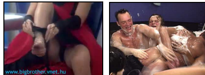
Figures 10 et 11. Hongroise légère, Suédois callipyge

Dans tous les cas, l'attitude très « politically correct » des sites Internet « officiels » bannit les images explicitement sexuelles. Tout au plus dévoile-t-on une petite culotte par ci (Figure 10), une fesse par là (Figure 11)... Étant donné le nombre de caméras en place et les mœurs de jeunes gens de vingt ans (les relations sexuelles sont légendaires en Espagne, et courantes en Allemagne, France, Pays-bas...), ce genre d'images ne peut guère échapper au dispositif ; il faut donc en conclure tout naturellement à une autocensure iconique sur Internet.