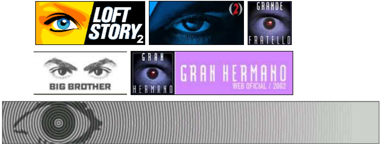
Figures 16, 17, 18, 19, 20 et 21. Emblèmes de la surveillance, les logos français, hongrois, italien, australien, espagnol et britannique ( http://www.loftstory.fr , http://www.bigbrother.vnet.hu/ , http://www.grandefratello.com/GF2/ , http://bigbrother.iprimus.com.au/_rego/default.asp , http://www.granhermano.com/home/default.htm , http://www.channel4.com/entertainment/tv/microsites/B/bigbrother/index.html )

Naturellement, l'entreprise Endemol, dont Big Brother est le produit phare, n'est pas en reste : son logo est également tout entier construit sur la métaphore du regard inquisiteur (Figure 22).