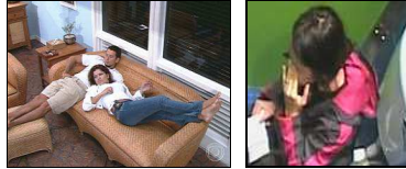
Figures 27 et 28. Vue plongeante, façon caméra de surveillance ( http://bbb.globo.com/BBB3/0,6993,BGI1-2527-GN1-3221325454---0,00.html , http://www.bigbrothersa.com/news/displayNews.asp?Id=1797 )

La manière de présenter les candidats, la rhétorique de l'image telle qu'elle se donne à voir en observant les sites sur Internet, est étrangement homogène : on a l'impression que la règle du jeu, « voir sans être vu », a été intériorisée dans le dispositif iconique – et que, volens nolens , elle dicte sa loi jusque dans l'acte de la représentation. À l'image, et quelle que soit la nationalité du site considéré, les joueurs sont donc croqués comme des suspects en puissance, comme des animaux dans une cage dorée... ce qu'ils sont peut-être en effet, même si c'est pour jouer. La seule composition de l'image contient tout entière les règles du jeu – tel l'hologramme qui, déchiré, « contient » encore tout le cliché.