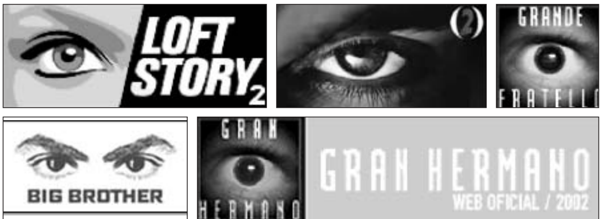
Figures 16, 17, 18, 19, 20 et 21. Emblèmes de la surveillance, les logos français, hongrois, italien, australien, espagnol et britannique

( http://www.bigbrotherworld.tv/page_low.htm , http://bbg.globo.com/ , http://www.bigbrother.se/ , http://www.bigbrother.vnet.hu/ )