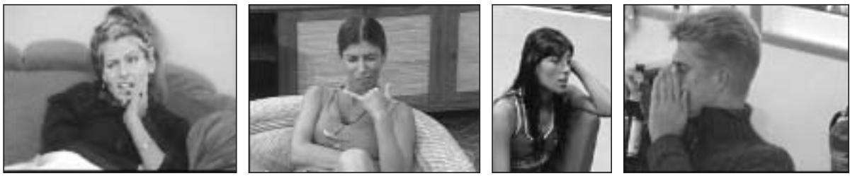
Figure 23, 24, 25 et 26

Portraits « morts » : en légère plongée, des expressions stéréotypées, des clichés volés, des cadrages inaccoutumés ( http://www.bigbrother.de/BB3/index.htm , http://www.terra.com.ar/canales/gh3/62/62051.html , http://bbb.globo.com/BBB3/0,6993,BG11-2527-GN1-3221325454-0,00.html , http://www.bigbrother.de/BB2/index.htm )