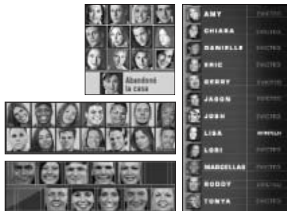
Figure 1, 2, 3 et 4

Sur un plan international, le jeu Big Brother et ses variantes est l'objet de très nombreux sites : plus d'une centaine pour la seule version américaine par exemple 5 (la version française en suscite presque autant, dont une quinzaine parodique, et une vingtaine consacrés au portrait de joueurs emblématiques 6 ). Pour la plupart, ils sont l'œuvre très hétérogène d'admirateurs, de parodistes, de jaloux, de critiques, voire de candidats recalés. On y trouve des milliers d'images censurées (ou prétendument censurées, comment savoir ?) ; des florilèges de citations ou d'extraits audio, des anthologies de mimiques, d'attitudes ou de gestes ; au long des forums de discussion, de longs dialogues enflammés entre internautes ; beaucoup de « rumeurs » (catégorie auto-éliminée, dont on se demande encore quel rapport elle peut encore avoir avec le bouche-à-oreille 7 ) ; et même de véritables espaces de repos visuel, telle cette version aquatique proposée par le site parodique « The Complete Big Brother : Life in the Fishbowl » : toutes les dix secondes, une nouvelle photo est donnée à voir d'un poisson rouge dans un aquarium 8 .