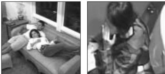
Figures 27 et 28

en effet, même si c'est pour jouer. La seule composition de l'image contient tout entière les règles du jeu - tel l'hologramme qui, déchiré, « contient » encore tout le cliché.