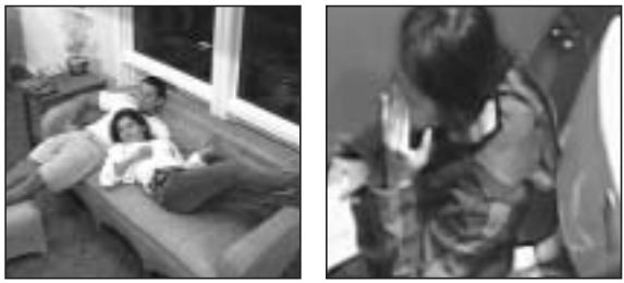
Figures 27 et 28

en effet, même si c'est pour jouer. La seule composition de l'image contient tout entière les règles du jeu - tel l'hologramme qui, déchiré, « contient » encore tout le cliché.