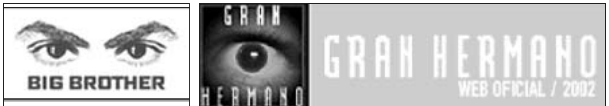
Figures 16, 17, 18, 19, 20 et 21. Emblèmes de la surveillance, les logos français, hongrois, italien, australien, espagnol et britannique

( http://www.loftstory.fr , http://www.bigbrother.vnet.hu/ , http://www.grandefratello.com/GF2/ , http://bigbrother.iprimus.com.au/_regio/default.asp , http://www.granhermano.com/home/default.htm , http://www.channel4.com/entertainment/tv/microsites/B/bigbrother/index.html )