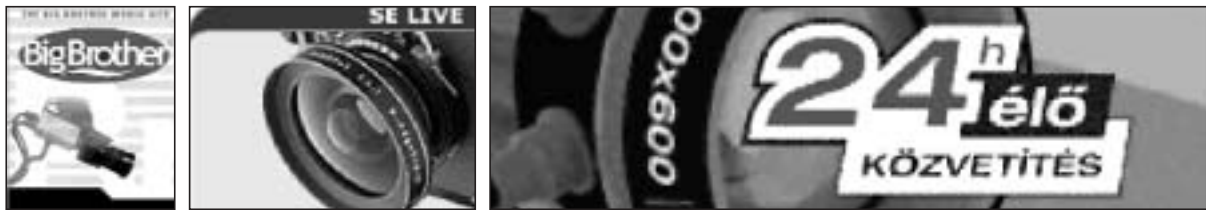
Figures 12, 13, 14 et 15. La caméra de surveillance, un motif quasi-identitaire

( http://www.bigbrotherworld.tv/page_low.htm , http://bbg.globo.com/ , http://www.bigbrother.se/ , http://www.bigbrother.vnet.hu/ )