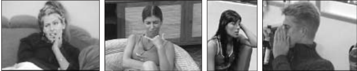
Figure 23, 24, 25 et 26

Portraits « morts » : en légère plongée, des expressions stéréotypées, des clichés volés, des cadrages inaccoutumés ( http://www.bigbrother.de/BB3/index.htm , http://www.terra.com.ar/canales/gh3/62/62051.html , http://bbb.globo.com/BBB3/0,6993,BG11-2527-GN1-3221325454-0,00.html , http://www.bigbrother.de/BB2/index.htm )