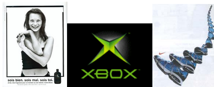
Des valeurs si bien intégrées que souvent seul le logo suffit à les réinvoyer

C'est bien ces quatre fonctions que l'on retrouve sous le discours officiel des professionnels lorsqu'ils définissent le pouvoir de la marque : le Publicitor recense trois valeurs créées par la marque pour le consommateur et qui sont l'assurance de qualité, le gain de temps et la valeur subjective 4 .