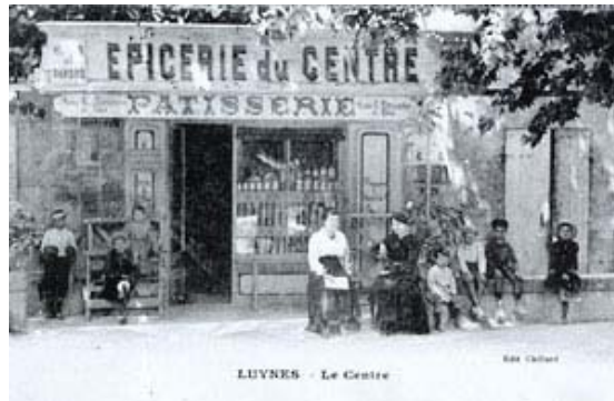
Les formules classiques de proximité...