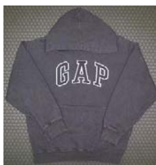
La marque s'affiche distinctement

Une nouvelle dimension a permis à la marque d'entrer dans le monde du symbolique lorsqu'elle est devenue ostentatoire. S'éloignant du simple registre rationnel, elle est cette fois-ci le vecteur d'affirmation d'une appartenance. Cette marque revendicatrice s'affiche violemment. C'est l'époque des noms arborés sur toute la surface du produit. Les marques élaborent un langage complexe destiné à permettre la revendication d'un groupe d'appartenance et les cibles deviennent des experts en reconnaissance de ces signes 3 . Les agences conseil en communication se convertissent aux théories des groupes de références à la suite du célèbre ouvrage de Jean Baudrillard La société de consommation, ses mythes, ses structures . Nouant des processus d'appartenance/exclusion, elle est cette marque critiquée par Roland Barthes à propos de la publicité Levi's, son actualisation la plus célèbre étant les publicités Hollywood Chewing-Gum mettant en scène un groupe de jeunes personnes dynamiques vivant dans un monde idéal des relations exceptionnelles.