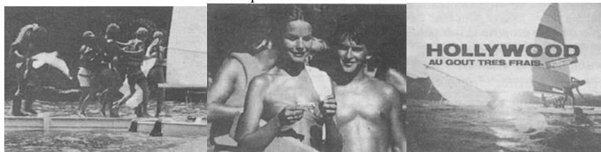
et renvoie à un groupe social estimé par l'individu.

Enfin, une dernière dimension pousse encore dans le domaine de la symbolisation de la marque en jouant cette fois-ci sur l'Ego de la cible. Sans se départir de son côté ostentatoire, elle va désormais offrir à l'individu des repères identitaires, des valeurs en lesquelles croire, devenant modèle à la place d'anciennes institutions de sens aujourd'hui moins influentes. Le groupe revendiqué dans la fonction précédente n'est plus à l'origine de la marque mais issu de celle-ci. Dans cette perspective, l'individu va former son identité sur la base de celles proposées par les marques qu'il côtoie, avantage d'autant plus grand pour ces dernières que cette identification se traduira par un choix exclusif d'une marque au profit d'une autre sur un segment donné. Ces nouveaux groupes issus et non plus initiateurs de marques sont désormais très étudiés en marketing sous l'angle du post-modernisme (Maffesoli 1988, Augé 1994), à l'aide de notions telles que la sous-culture de consommation (Schouten et Mac Alexander, 1993, 1995), les tribus post-modernes (Cova, 1995) ou la communauté de marque (Muniz et O'Guinn, 2001) qui ont toutes en commun, sous leurs nuances théoriques, de valider ce nouveau rapport intime à la marque.