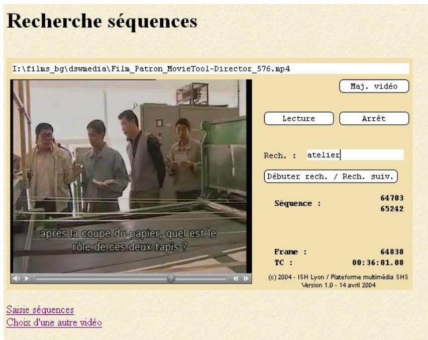
Fig. 6 – Ecran de recherche.

Elle permet d'accéder instantanément à un segment donné après avoir saisi un mot-clef de l'indexation. Si plusieurs segments répondent au même critère de recherche, les différents segments peuvent être visualisés successivement. L'outil de recherche actuel n'est ici présent que pour vérifier l'indexation du média : dans l'exemple ci-dessous, la recherche est une simple recherche plein texte utilisant un arbre DOM XML classique. Le moteur de recherche est adaptable au gré du chercheur suivant l'application (Web ou CD/DVD-ROM) : il peut donc au besoin tirer partie de la structure des annotations (ex. : je cherche une séquence dont le <Who><Name> est X ?).