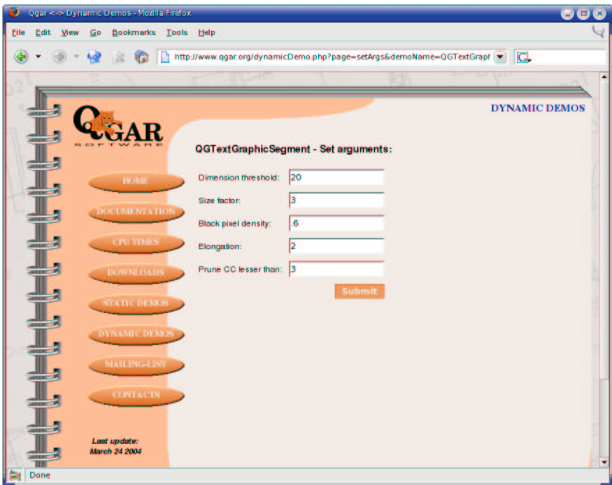
FIG. 4 – Formulaire HTML construit automatiquement pour la segmentation texte-graphique sur le site web du système Qgar.