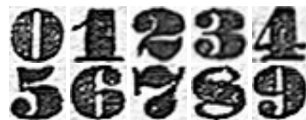
FIG. 1 – Exemples de chiffres imprimés dans une police de caractères ancienne (extraits des inventaires-sommaires des Archives Départementales de Charente Maritime).

La numérisation des collections de documents anciens représente des enjeux sociétaux et culturels certains, mais le traitement des corpus d'images ainsi constitués pose une multitude de problèmes techniques. C'est dans ce contexte que nous nous sommes intéressés aux prises de vues réalisées sur les inventaires-sommaires des Archives Départementales de Charente Maritime. Ces documents constituent un corpus d'instruments de recherche (c'est à dire des méta-documents) utiles aux archivistes puisqu'ils recensent et commentent de nombreux actes officiels (décisions de justice, actes notariés, décrets civils ou religieux, etc.) remontant jusqu'au seizième siècle. Un ensemble de 209 images capturées forment une base que nous