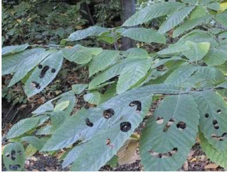
Emotikons directement gravés dans les feuilles d'un arbre et photographiés.

Les multiples jeux sur l'image que l'on peut observer dans le blog de K@aloo sont significatifs du tournant pris par une partie des pratiques artistiques contemporaines : celles qui jouent sur les nouvelles limites du corps amplifié par des prothèses et sur ce qui fait qu'un être humain est considéré comme un homme, c'est-à-dire sur la définition même du post-humain. L'image ci-dessus se situe parfaitement dans ce courant en illustrant la problématique de l'iconisation du vivant.