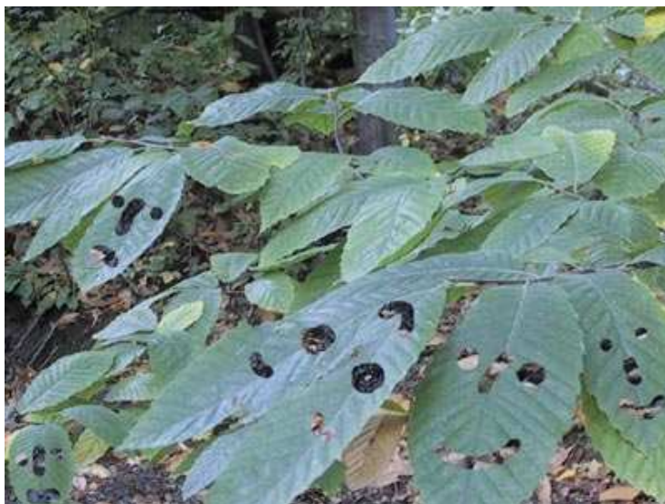
Emotikons directement gravés dans les feuilles d'un arbre et photographiés.

Les multiples jeux sur l'image que l'on peut observer dans le blog de K@aloo sont significatifs du tournant pris par une partie des pratiques artistiques contemporaines : celles qui jouent sur les nouvelles limites du corps amplifié par des prothèses et sur ce qui fait qu'un être humain est considéré comme un homme, c'est-à-dire sur la définition même du post-humain. L'image ci-dessus se situe parfaitement dans ce courant en illustrant la problématique de l'iconisation du vivant.