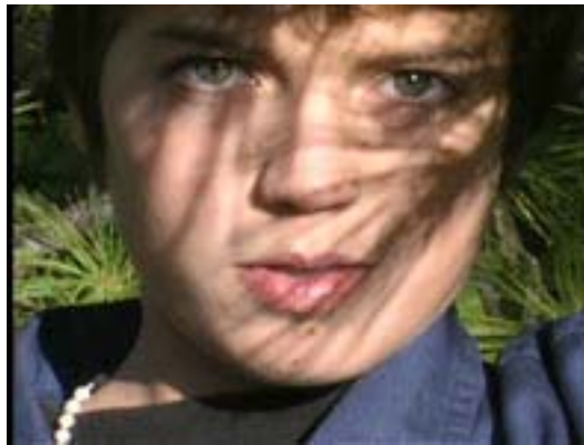
Figure 2.