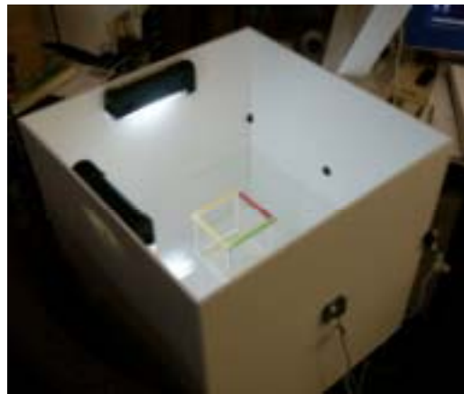
Figure 6. Simon Greenwold, EyeBox , Box with calibration object.