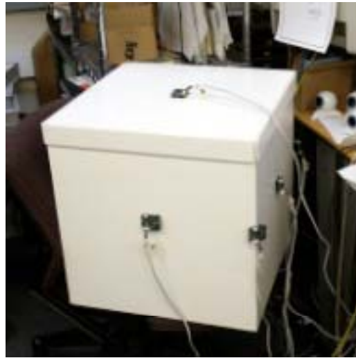
Figure 4. Simon Greenwold, EyeBox , Whole Box.