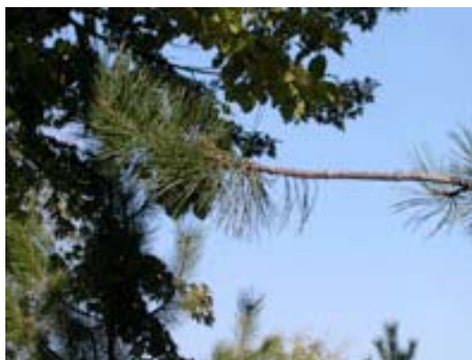
Figure 3.

En quelque sorte, la branche nous impose son temps par la pérégrination de son ombre, et nous, nous imposons notre temps perceptif en déambulant sur la crête de plusieurs montagnes alignées par la projection.