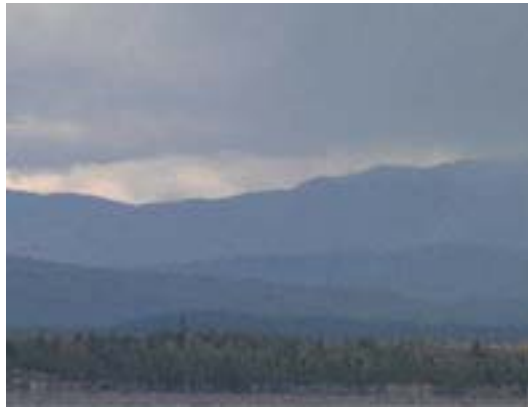
Figure 1.