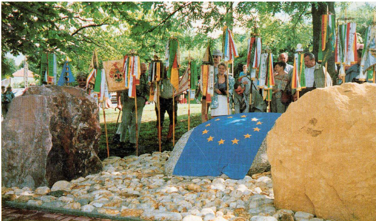
(Photo Bulletin municipal de Spicheren , 1991 : Monument de l'Europe implanté en bordure de la D 32c, sur le site historique des Hauteurs de Spicheren (Moselle), à une centaine de mètres de la Grande Croix du Souvenir Français, à l'endroit même où, en 1968, se trouvait encore le poste frontière des Douanes Françaises).

avons surtout tenté de saisir, en nous glissant dans la foule des quelques 50 à 70 participants, la rhétorique dominante c'est-à-dire la trame de ce qui est publiquement racontable sur les événements du passé, le discours modèle qui sert de référence à ceux et celles qui veulent comprendre l'histoire. Les observations ont permis de constater que les lieux et les monuments sont d'importants opérateurs de médiation dans une transmission au niveau local. Dès les premiers contacts, c'est vers eux que le chercheur a été « naturellement » conduit par ses informateurs. Ils constituent un passage obligé pour saisir la mémoire historique des batailles de Spicheren ; ils sont aussi et surtout, les objets d'un investissement de forme tels que les définit Laurent Thévenot (1986, 21-71) : s'ils contribuent à faciliter l'identification immédiate de plusieurs événements du passé, ils ne préfigurent ou ne consacrent cependant pas de manière décisive ou définitive les différentes manifestations mémorielles qui s'y rapportent.