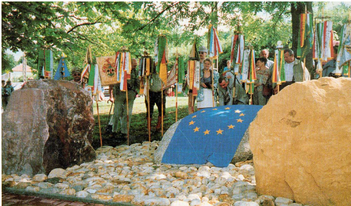
(Photo Bulletin municipal de Spicheren , 1991 : Monument de l'Europe implanté en bordure de la D 32c, sur le site historique des Hauteurs de Spicheren (Moselle), à une centaine de mètres de la Grande Croix du Souvenir Français, à l'endroit même où, en 1968, se trouvait encore le poste frontière des Douanes Françaises).

avons surtout tenté de saisir, en nous glissant dans la foule des quelques 50 à 70 participants, la rhétorique dominante c'est-à-dire la trame de ce qui est publiquement racontable sur les événements du passé, le discours modèle qui sert de référence à ceux et celles qui veulent comprendre l'histoire. Les observations ont permis de constater que les lieux et les monuments sont d'importants opérateurs de médiation dans une transmission au niveau local. Dès les premiers contacts, c'est vers eux que le chercheur a été « naturellement » conduit par ses informateurs. Ils constituent un passage obligé pour saisir la mémoire historique des batailles de Spicheren ; ils sont aussi et surtout, les objets d'un investissement de forme tels que les définit Laurent Thévenot (1986, 21-71) : s'ils contribuent à faciliter l'identification immédiate de plusieurs événements du passé, ils ne préfigurent ou ne consacrent cependant pas de manière décisive ou définitive les différentes manifestations mémorielles qui s'y rapportent.