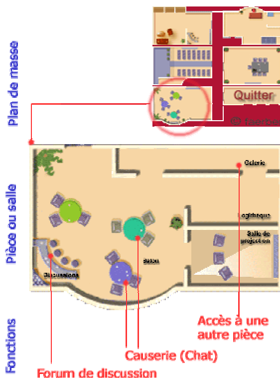
Figure 2 : différentes composantes du foyer

Chaque pièce pourra se composer de plusieurs fonctions et espaces de travail et pourra ouvrir sur d'autres pièces. Si nous détaillons le foyer on aura :