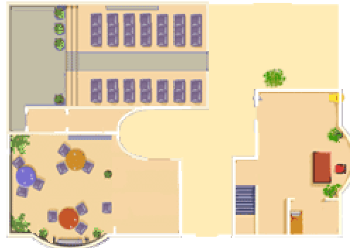
Figure 1: représentation des lieux sur ACOLAD

Ici on trouve les représentations des salles de cours, du foyer et du bureau personnel de l'apprenant.