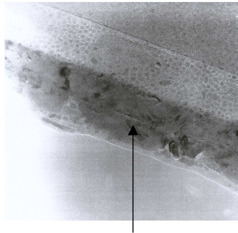
Fig. 1. Ligne blanche que les chercheurs évoquent dans la conversation Image MET Multicouches cuivre, fer, cobalt sur silicium x 840000.

Nous voyons bien à travers cet extrait qu'il est très difficile pour les chercheurs de donner sens à ce qu'ils voient. Il leur faut identifier les éléments contenus dans l'image et parvenir à un accord quant à cette identification. L'objectif est bien la création d'un univers sémantique commun. Celui-ci doit comporter un certain nombre d'unités minimales et de relations entre ces unités minimales. A partir de là se construit le sens des images au cours d'une observation déterminée, mais aussi pour les observations à venir. La constitution d'un tel univers sémantique suppose d'abord la prise en compte de la matérialité des images. Celles-ci présentent des caractéristiques matérielles perçues par les appareils sensoriels des chercheurs. C'est cette dimension première que nous souhaitons étudier d'abord, en recourant aux travaux menés par le Groupe \mu . L'approche microsémiotique de ce dernier vise précisément à rendre compte de l'émergence du sens lié à la matérialité de l'image, au niveau des composants élémentaires de celle-ci.